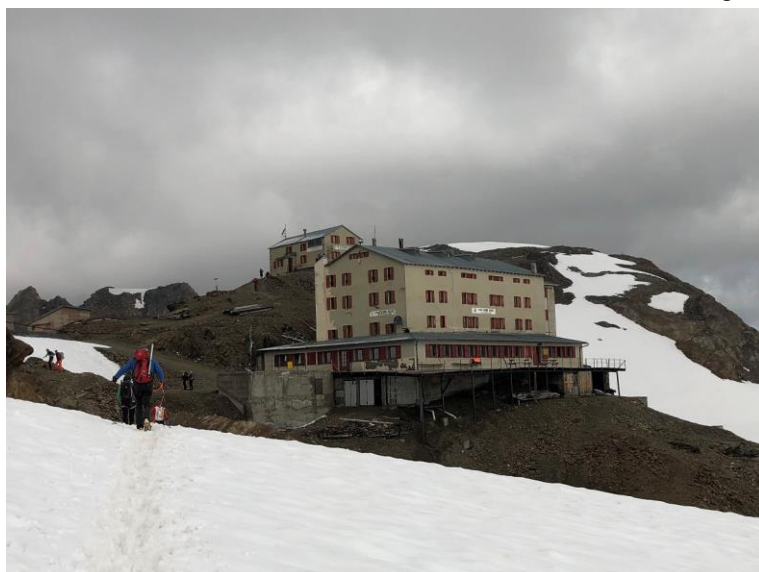
Refugio Casati / Martelltal