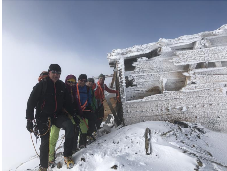
Ehemalige Militär Baracke direkt neben dem Gipfelkreuz