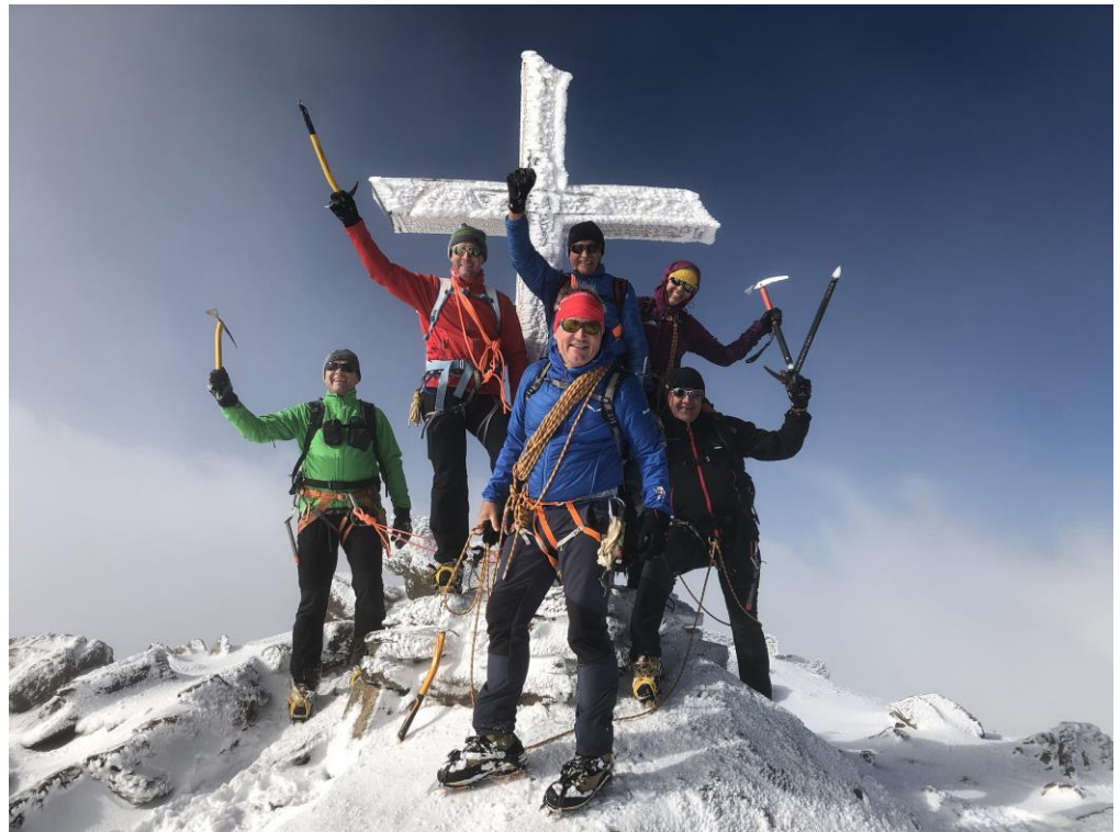
Auf dem Gipfel des Monte Cevedale

Tourenleiter: Urs Spirig / Markus Steiger Anzahl Teilnehmer: 6 (inkl. TL) Datum, Ziel: 02. / 03.08.2019 Talort: Sulden / Südtirol Anreise mit: Pw