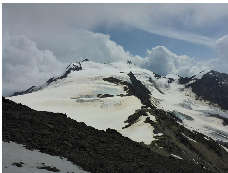
Zufallspitze und Cevedale von Suldenspitze aus