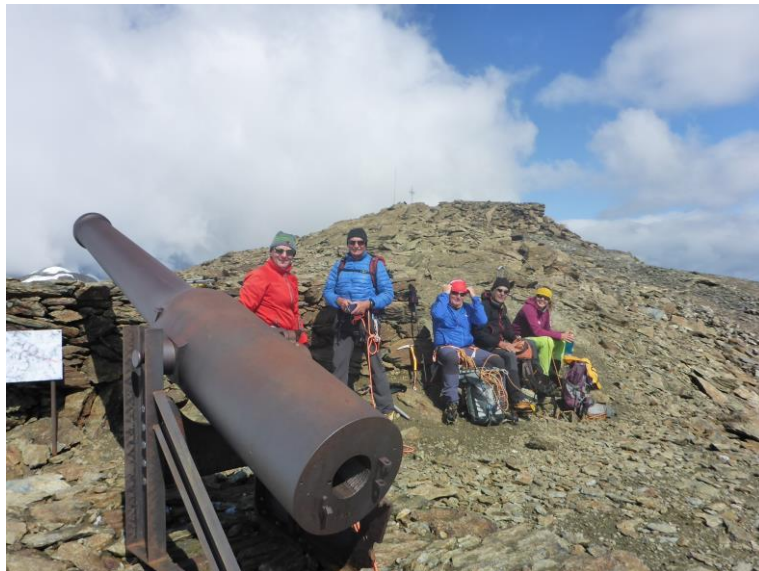
Bei den "Tre Cannoni" einem Relikt aus dem ersten Weltkrieg