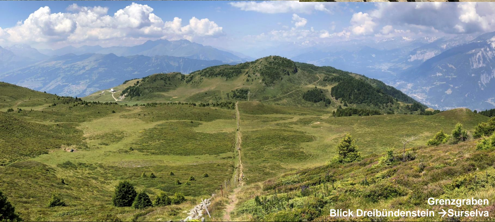
Grenzgraben Blick Dreibündenstein → Surselva