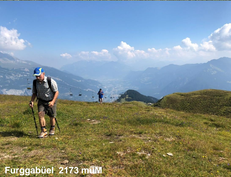
Furrgabüel 2173 müM