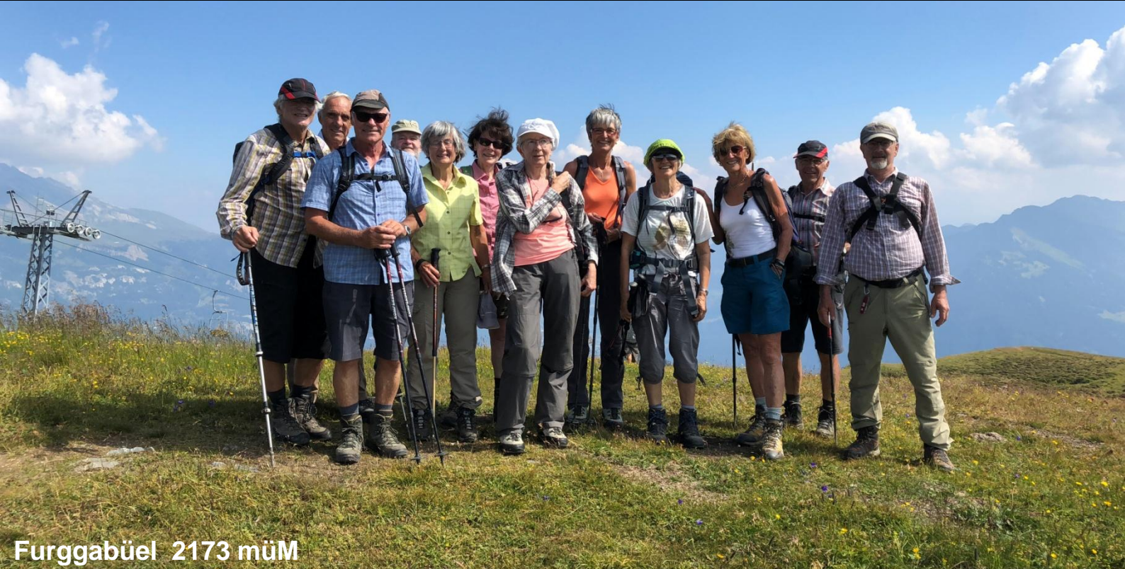
Furrgabüel 2173 müM