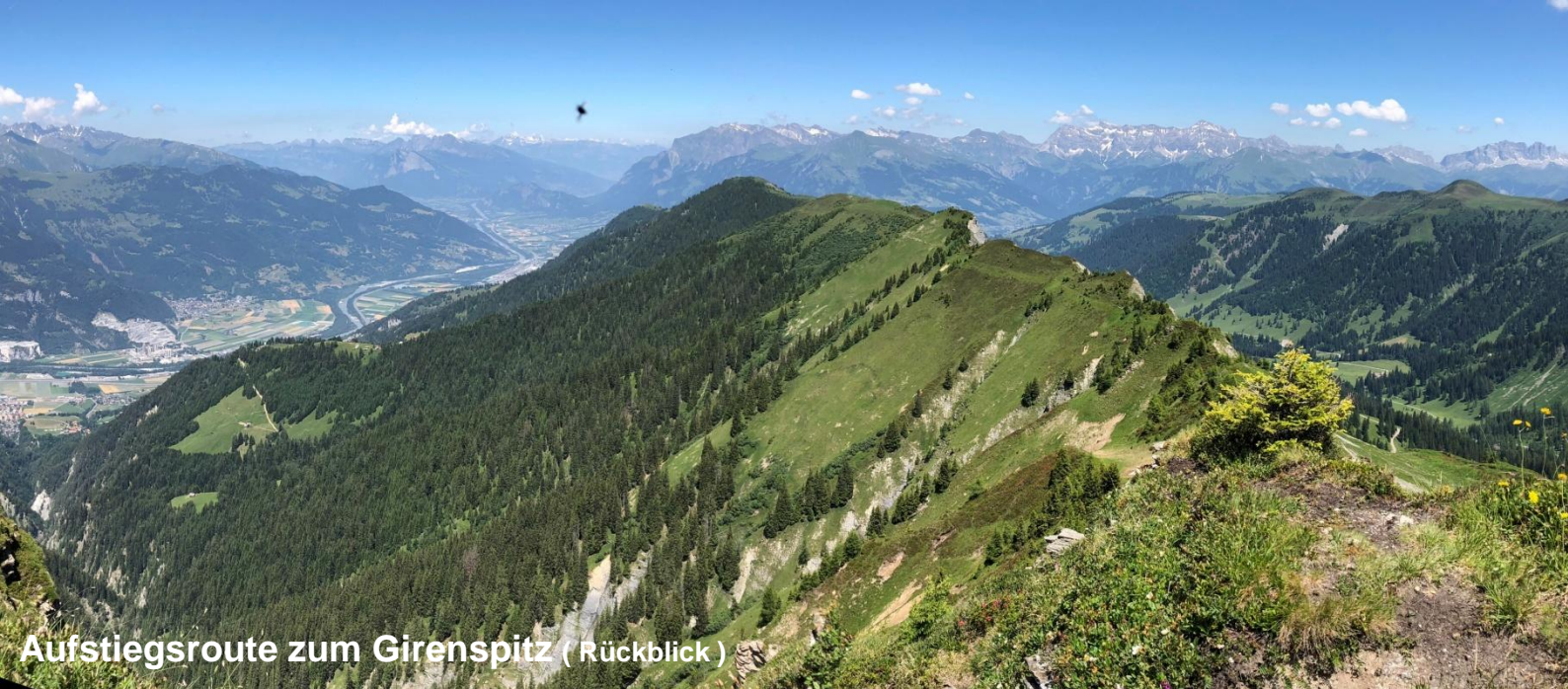
Aufstiegsroute zum Girenspitz ( Rückblick )