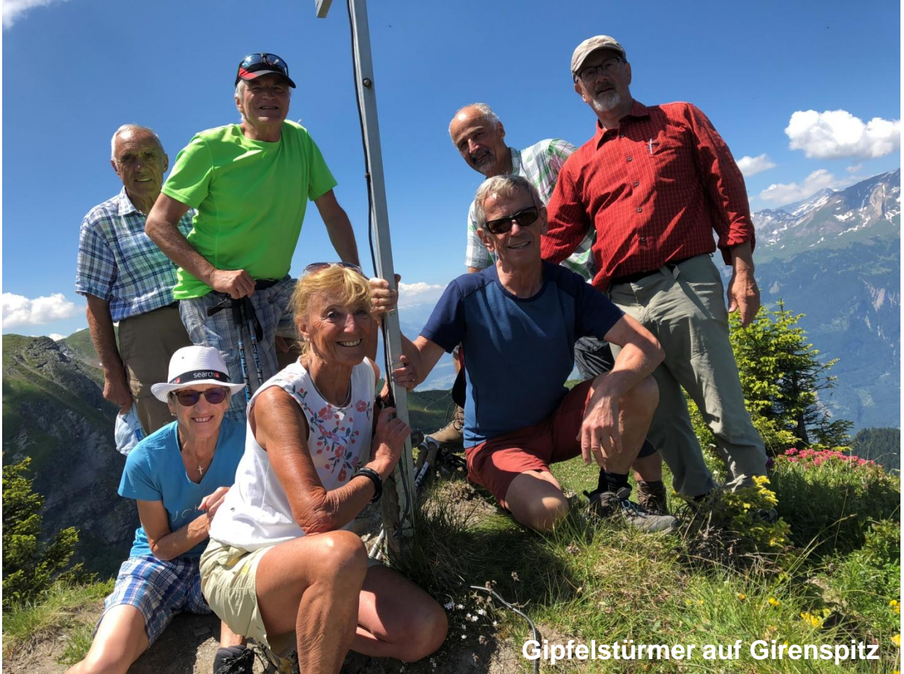
Gipfelstürmer auf Girens spitz