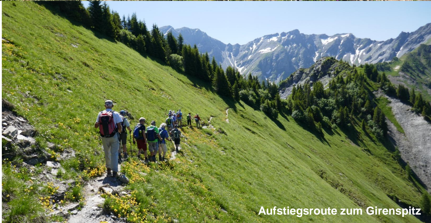
Aufstiegsroute zum Girenspitz