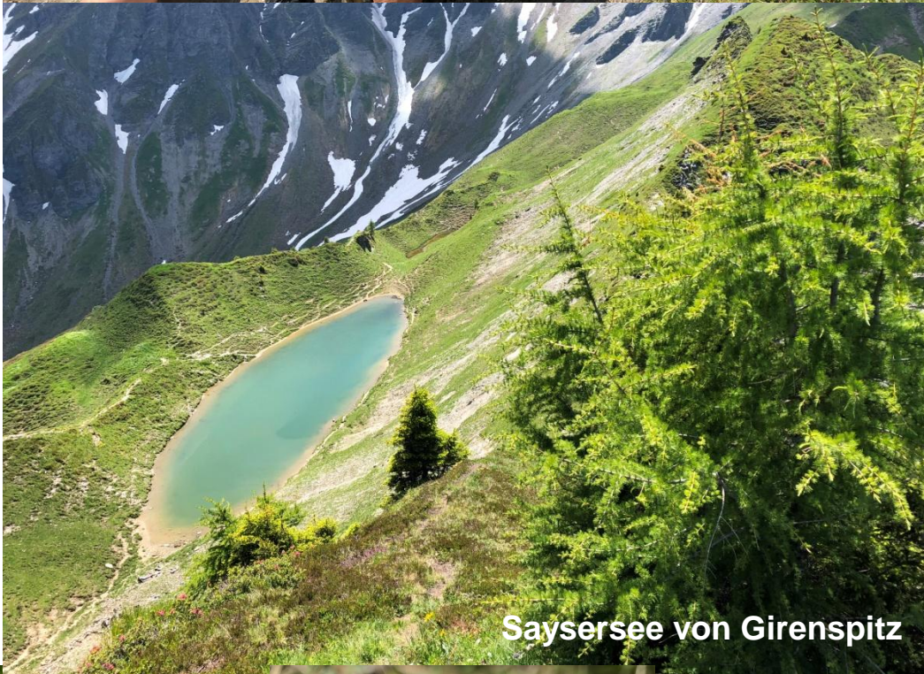
Says ersee von Girens spitz