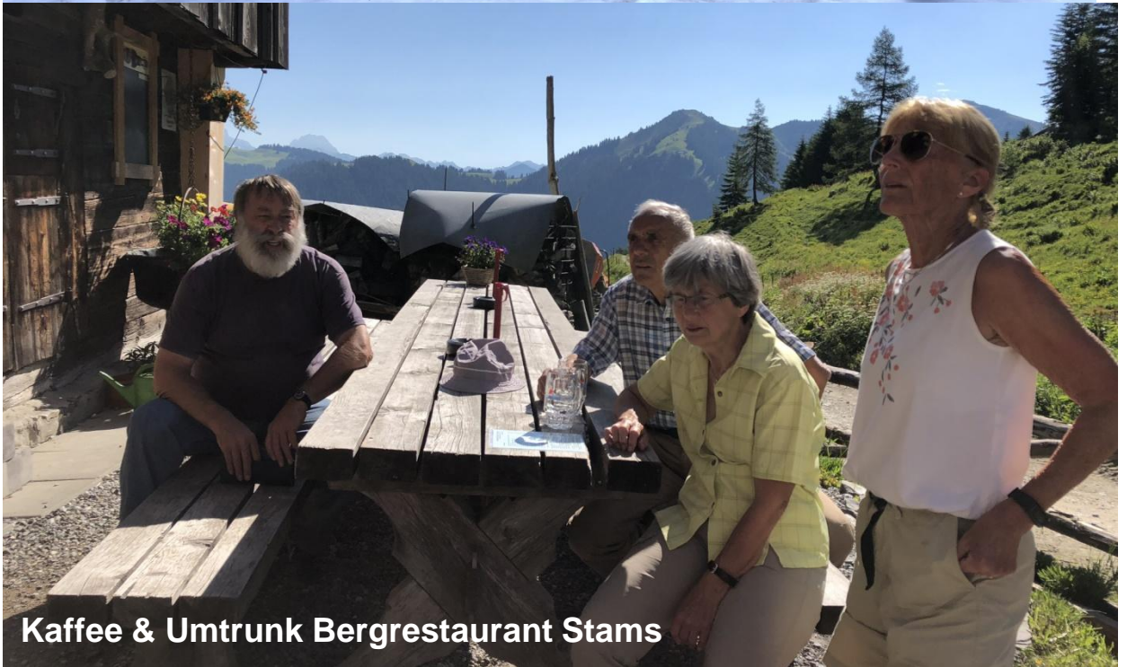
Kaffee & Umtrunk Bergrestaurant Stams