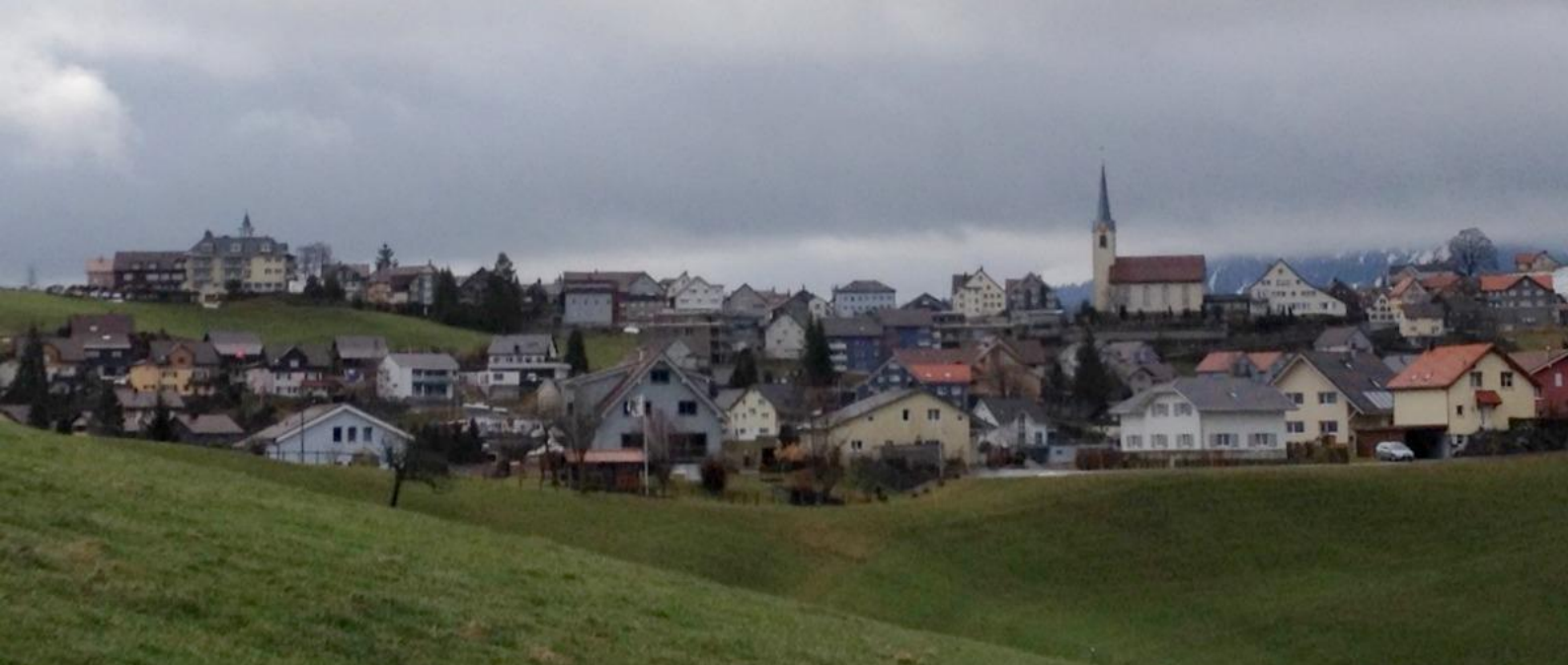
Schwellbrunn noch 1/2 h bis zum Mittagessen