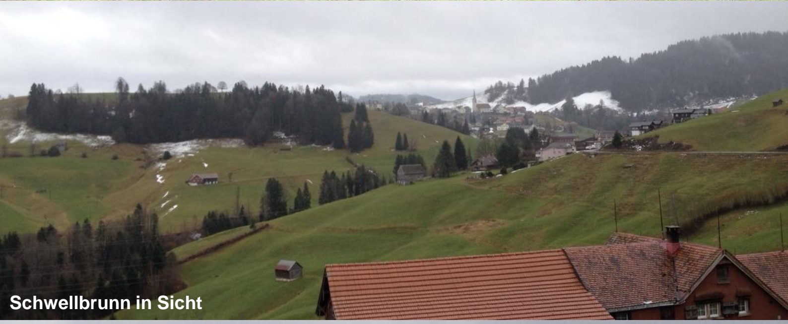
Schwellbrunn in Sicht