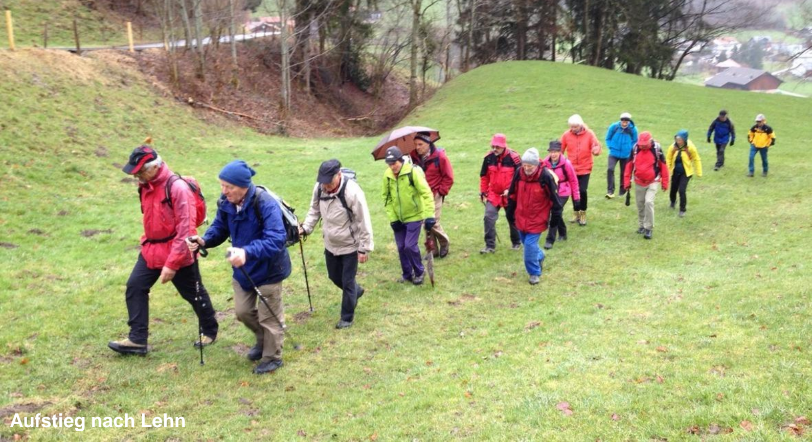
Aufstieg nach Lehn