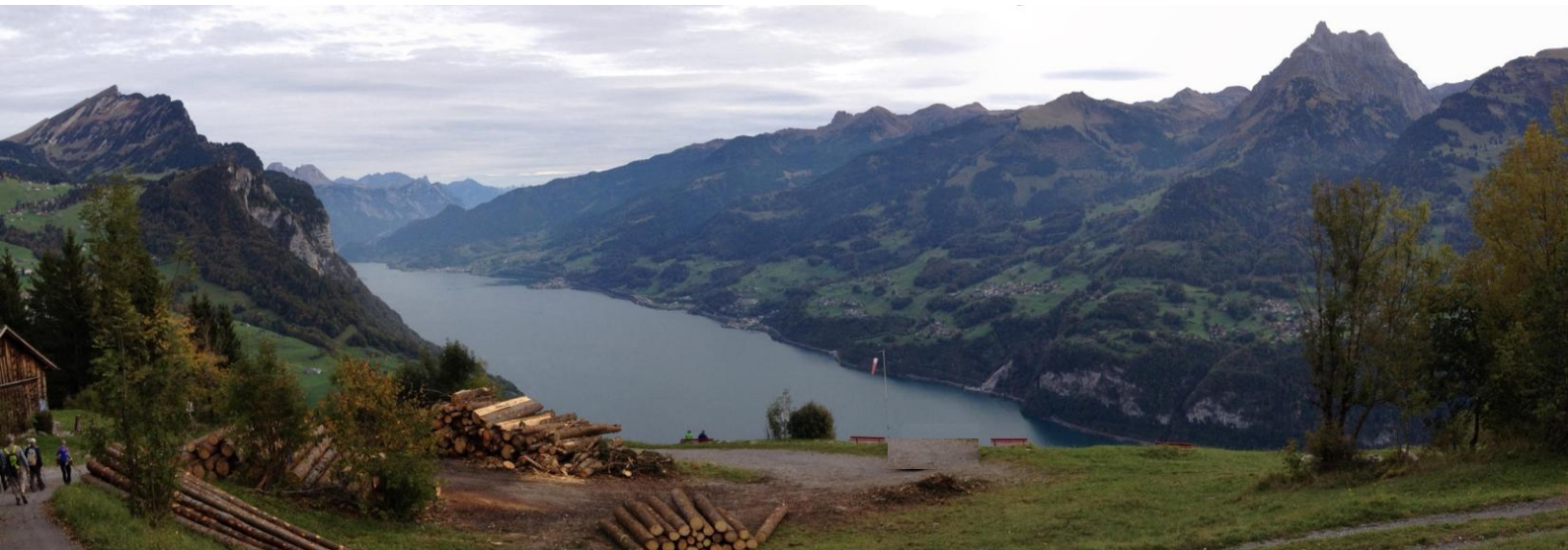
Panorama Walensee Leistchamm Alvier ..... Mürtchenstock