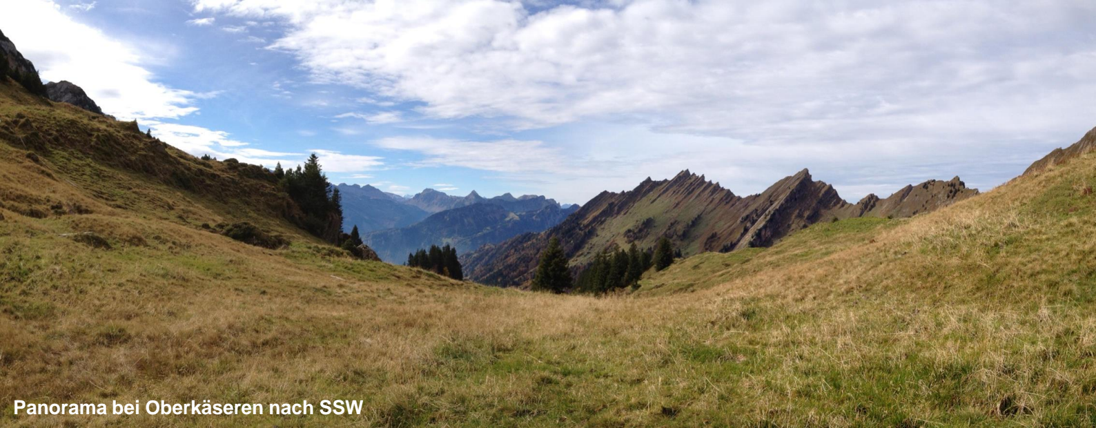
Panorama bei Oberkäseren nach SSW