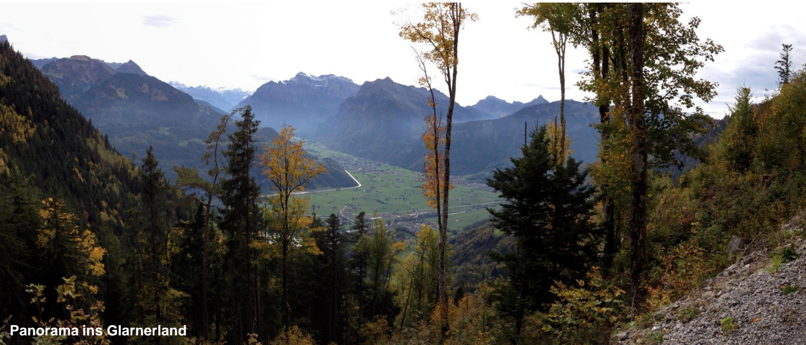
Panorama ins Glarnerland