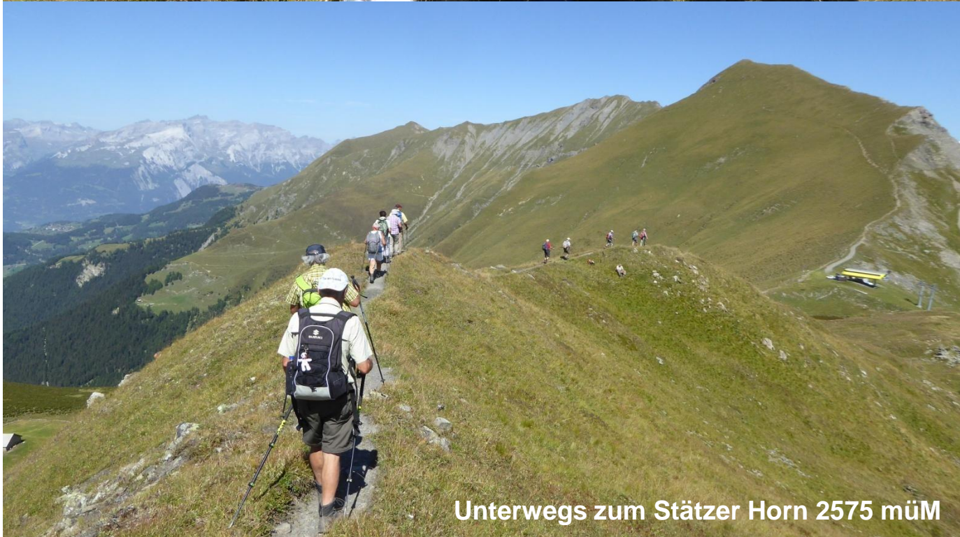
Unterwegs zum Stätzer Horn 2575 müM