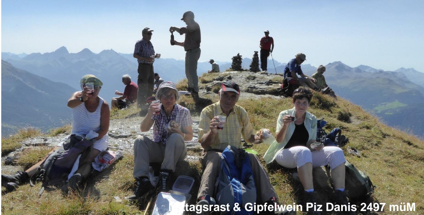
Freitagstrast & Gipfelwein Piz Danis 2497 müM