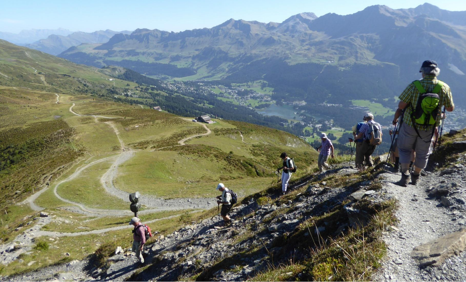
Abmarsch Piz Scalottas; 2321 müM