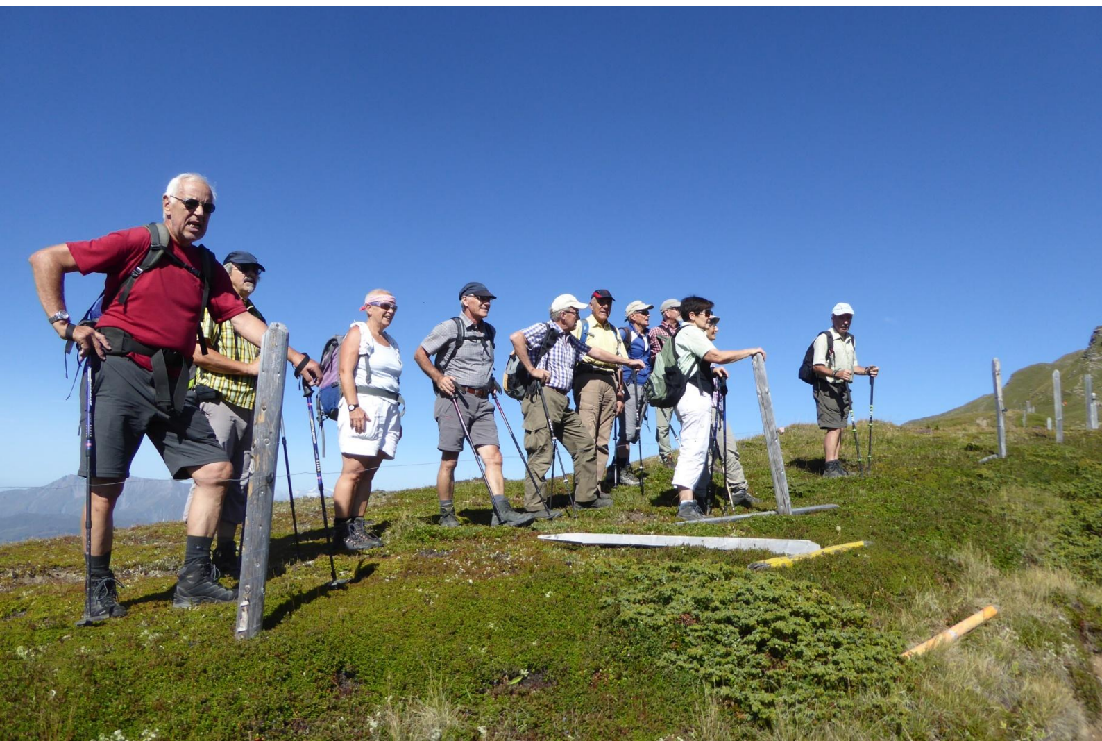
Welche 360 Grad Aussicht I