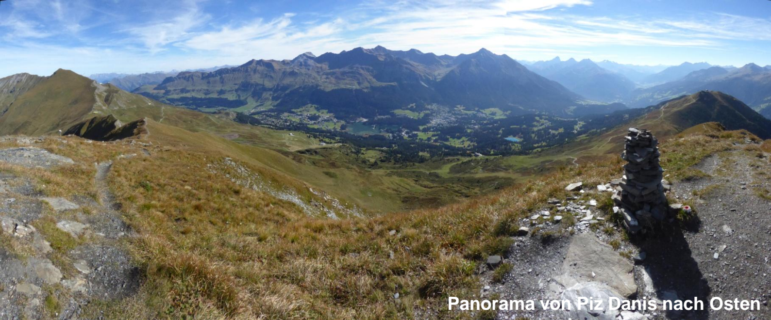
Panorama von Piz Danis nach Osten