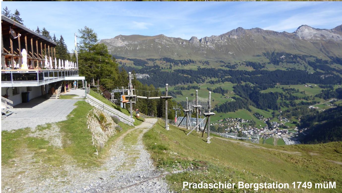
Pradaschier Bergstation 1749 mÜM