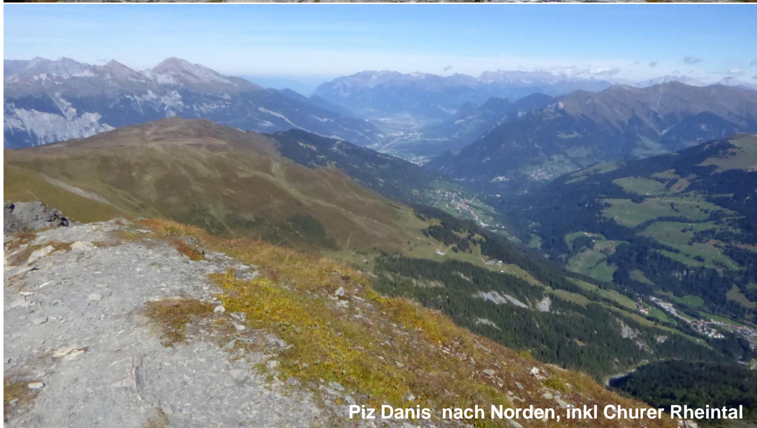
Piz Danis nach Norden, inkl Churer Rheintal