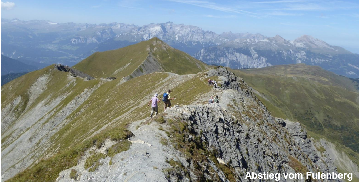
Abstieg vom Fulenberg