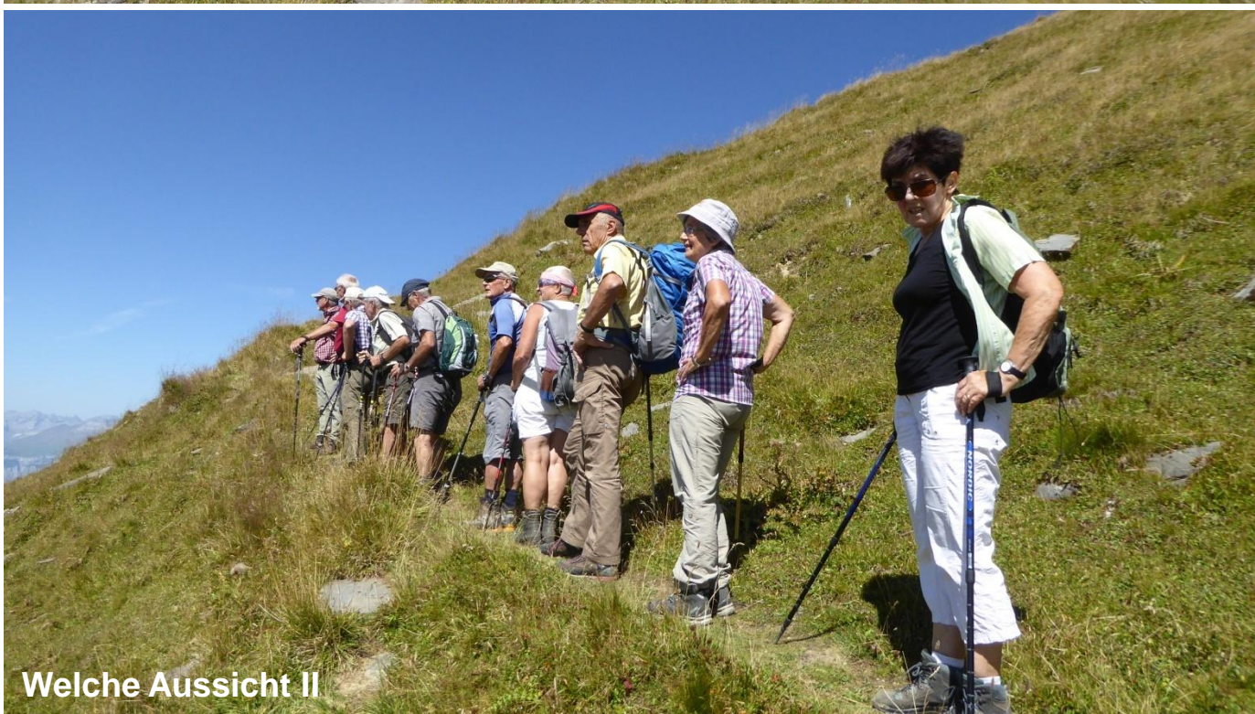
Welche Aussicht II