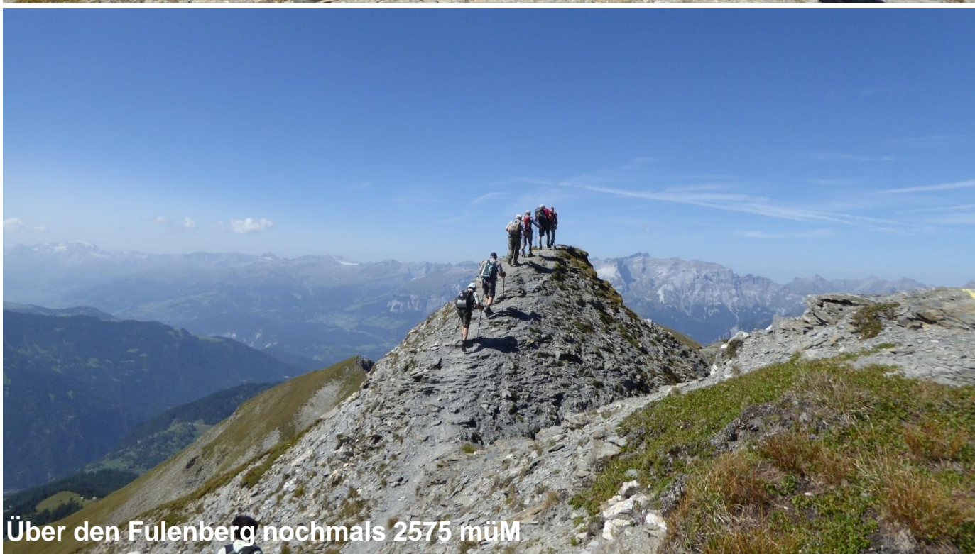
Über den Fulenberg nochmals 2575 müM