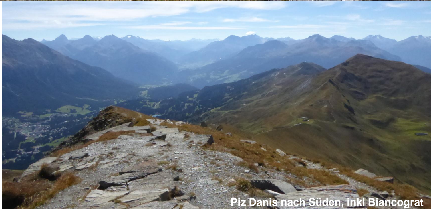
Piz Danis nach Süden, inkl Biancograt