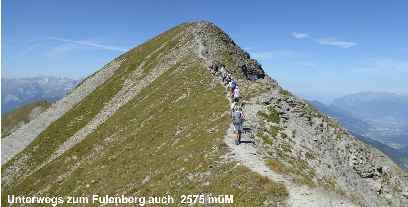
Unterwegs zum Fulenberg auch 2575 müM