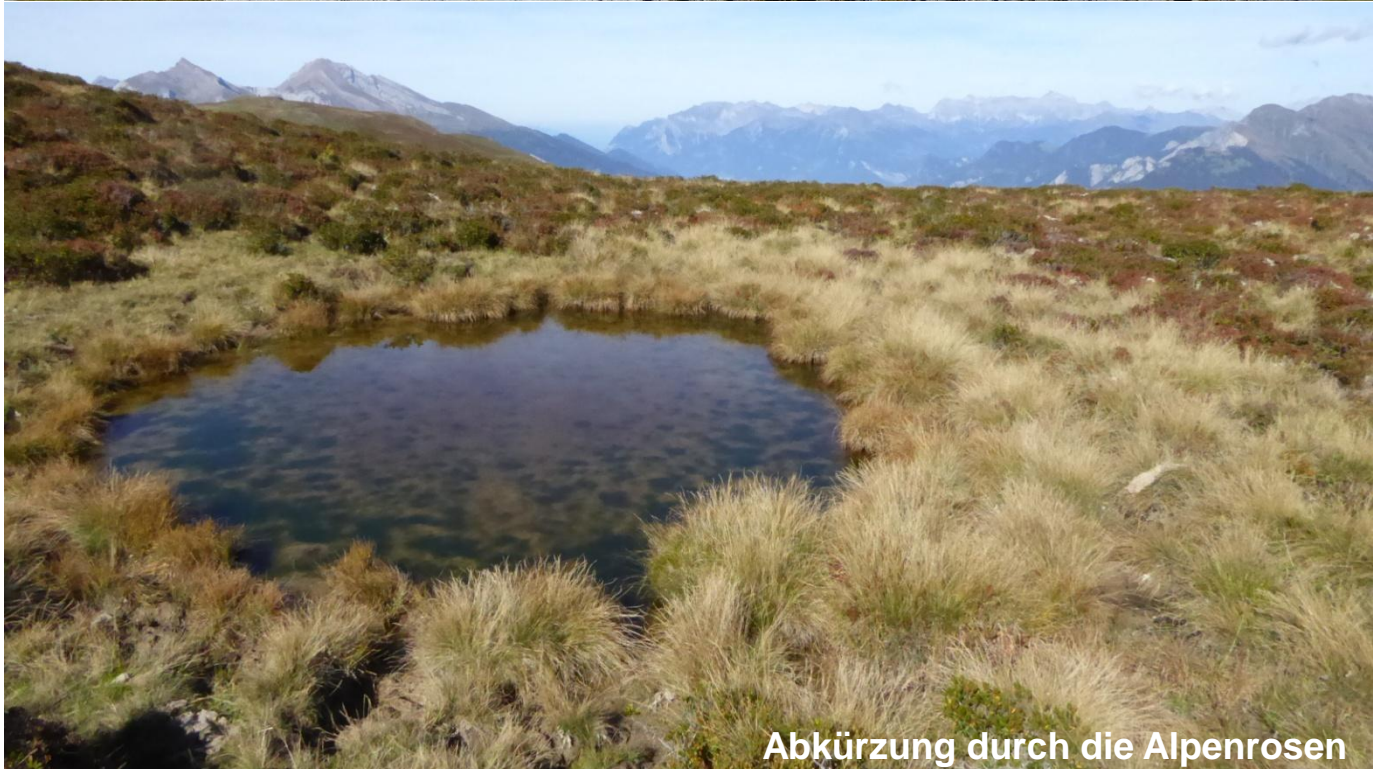
Abkürzung durch die Alpenrosen