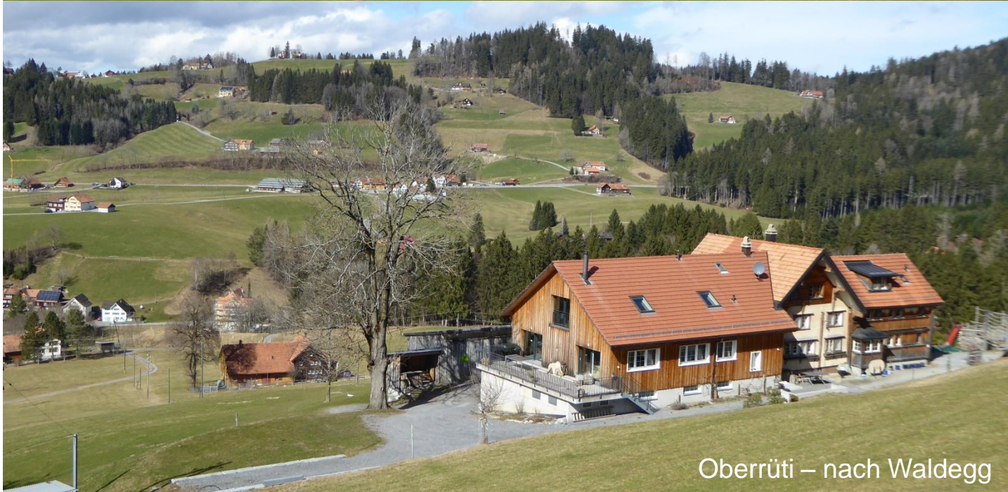
Oberrüti – nach Waldegg