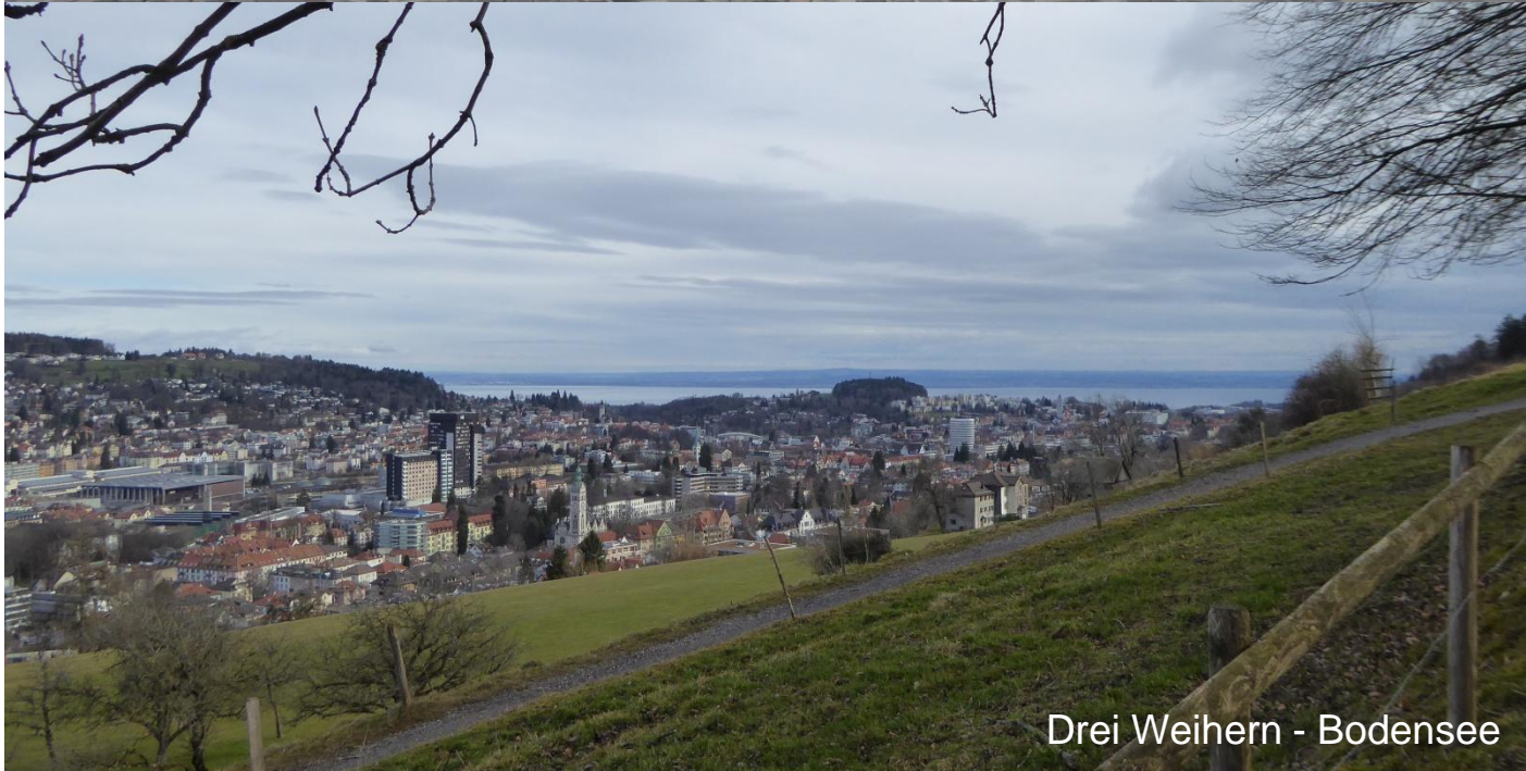
Drei Weihern - Bodensee