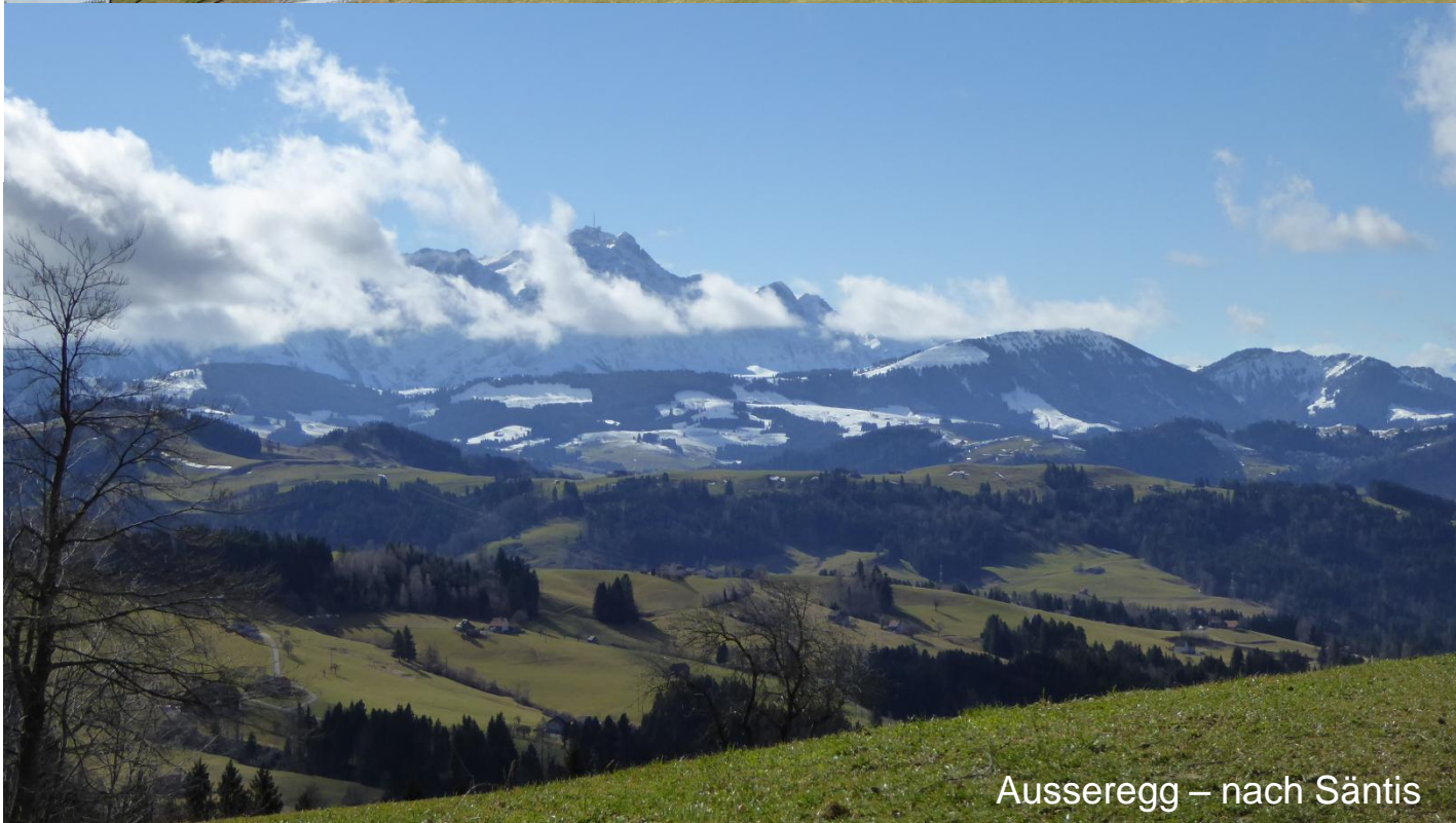
Ausseregg – nach Säntis