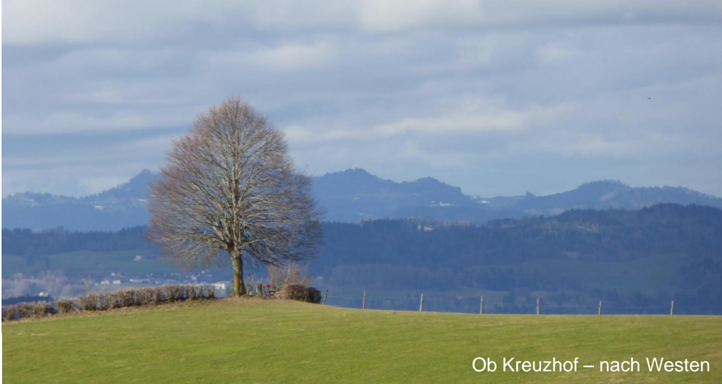
Ob Kreuzhof – nach Westen