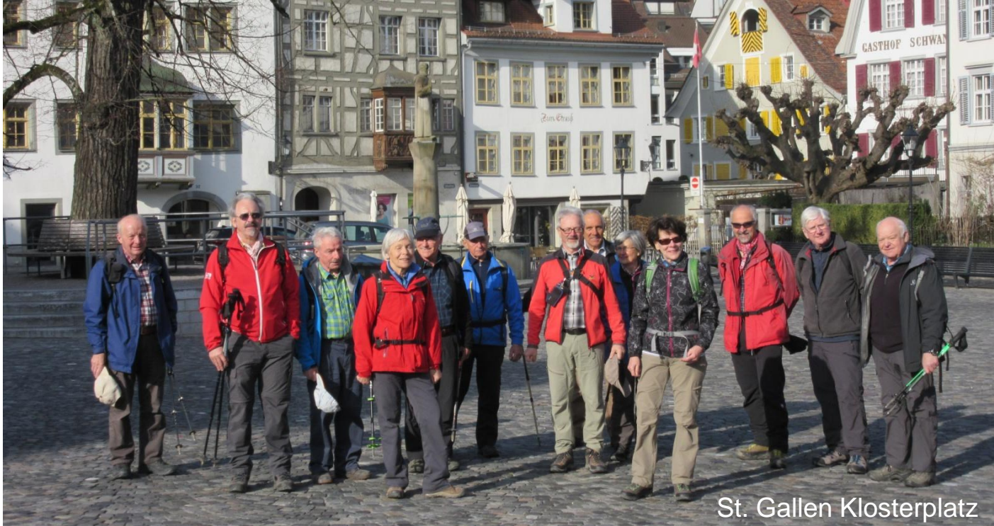
St. Gallen Klosterplatz