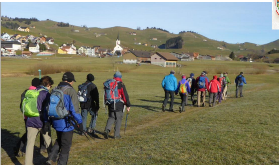
Barfussweg bei Gonten ( Biberli Highway )