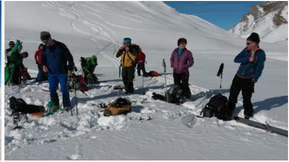
Der Tee- Pausenplatz beim Obersäss, und unser Mittagsrastplatz im Isisizer- Riet