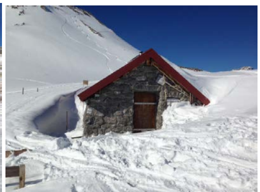
Isisizer Grat und Glanna Hütte ( beide ca. 2015 m.ü.M.)