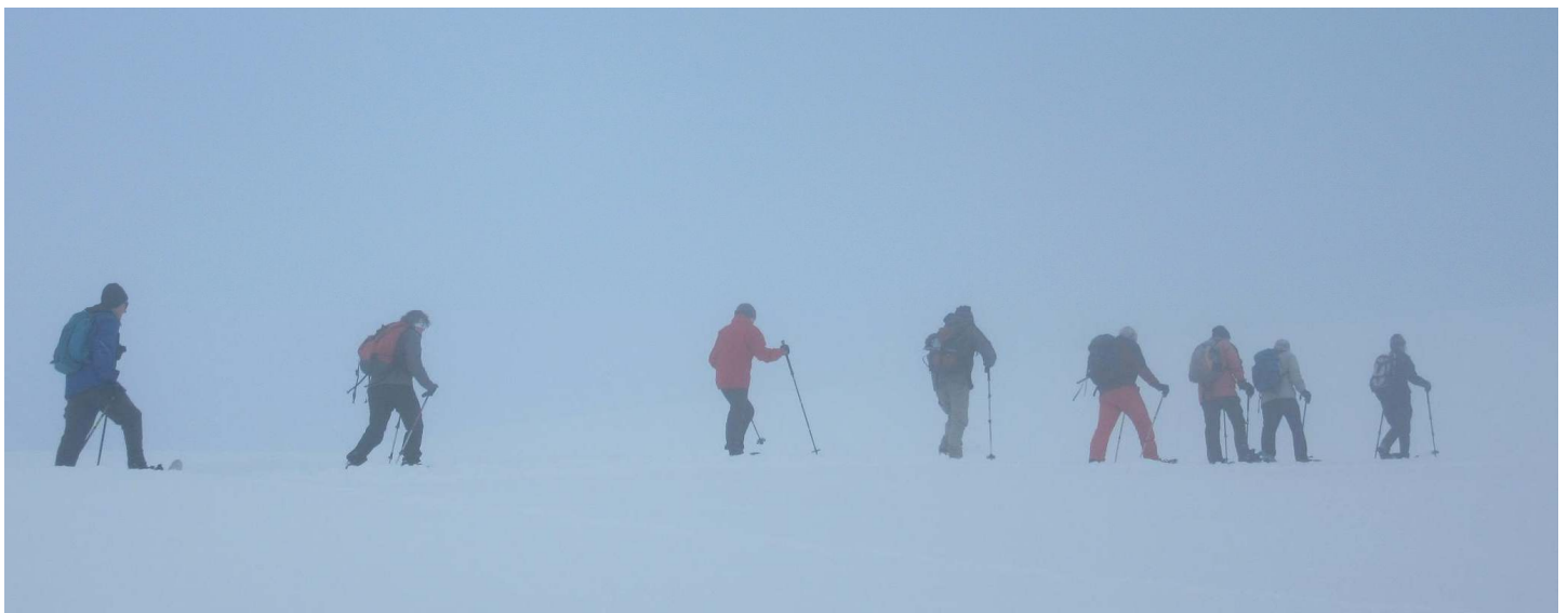
Schneeschuhwandern pur: Im „luftleeren Raum“ zwischen Himmel und Erde . . .