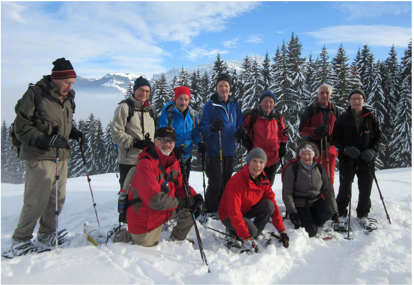
solche Sonnenfenster - sogar mit Weitsicht (z.B Hochalp) - waren uns nur für kurze Zeit gegönnt . . .