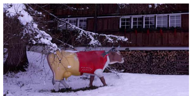
Kuriositäten in Urnäsch