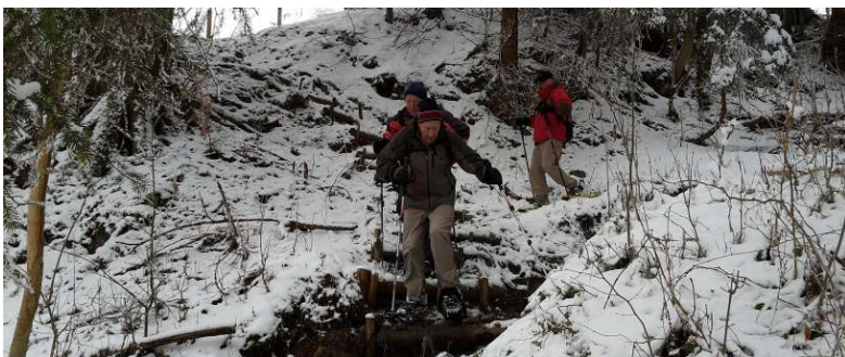
Treppen steigen mit Schneeschuhen muss geübt sein ...