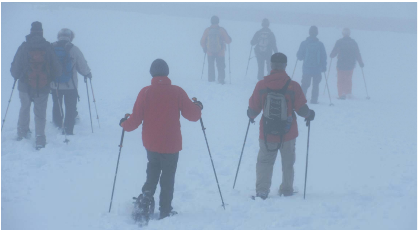
. . . jedes Einzelne sucht seine eigene Spur.