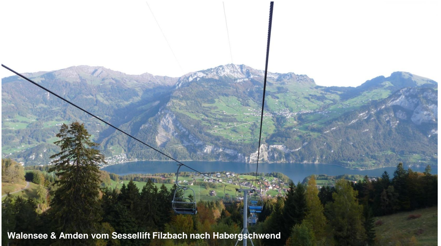
Walensee & Amden vom Sessellift Filzbach nach Habergschwend