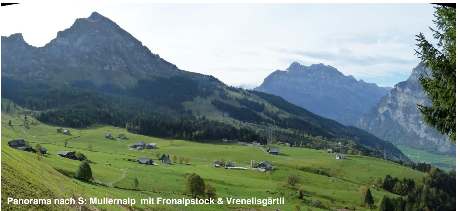
Panorama nach S: Mullernalp mit Fronalpstock & Vrenelisgärtli