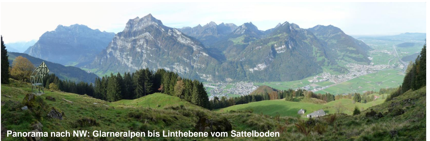
Panorama nach NW: Glarneralpen bis Linthebene vom Sattelboden