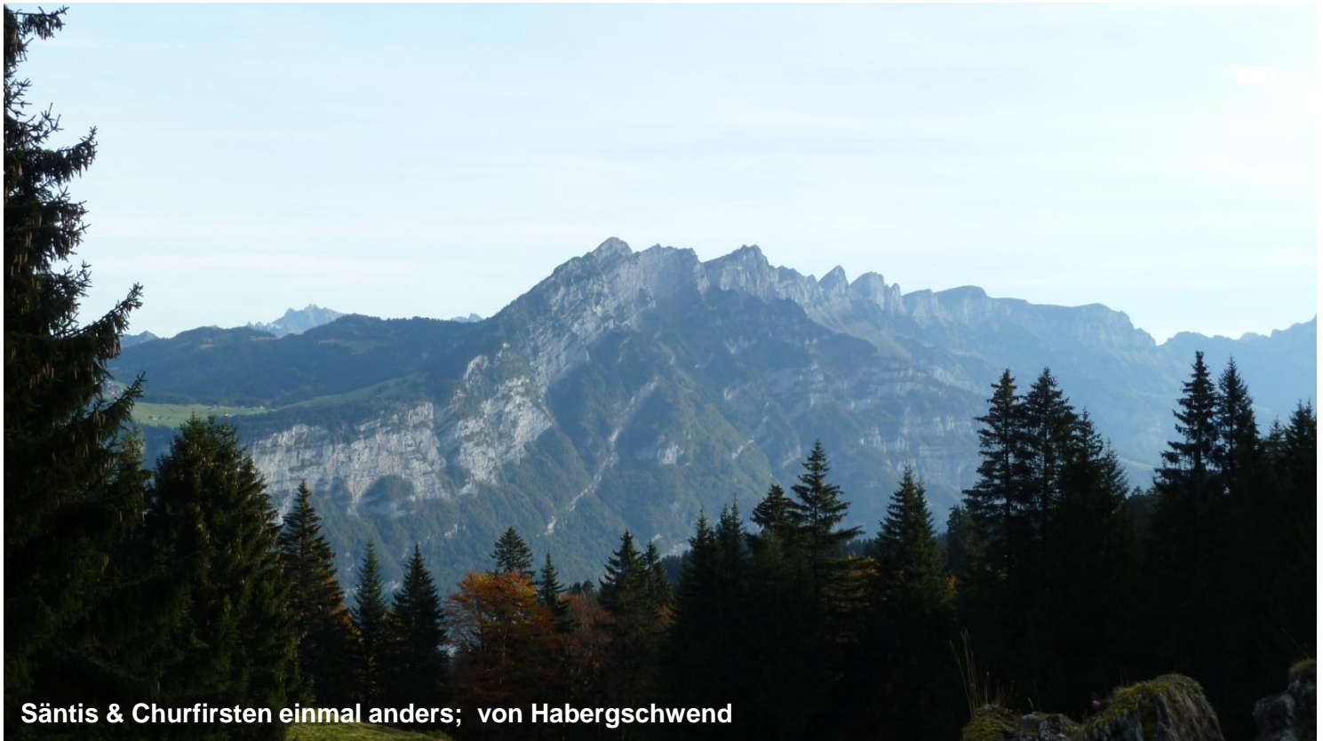
Säntis & Churfirnen einmal anders; von Habergschwend