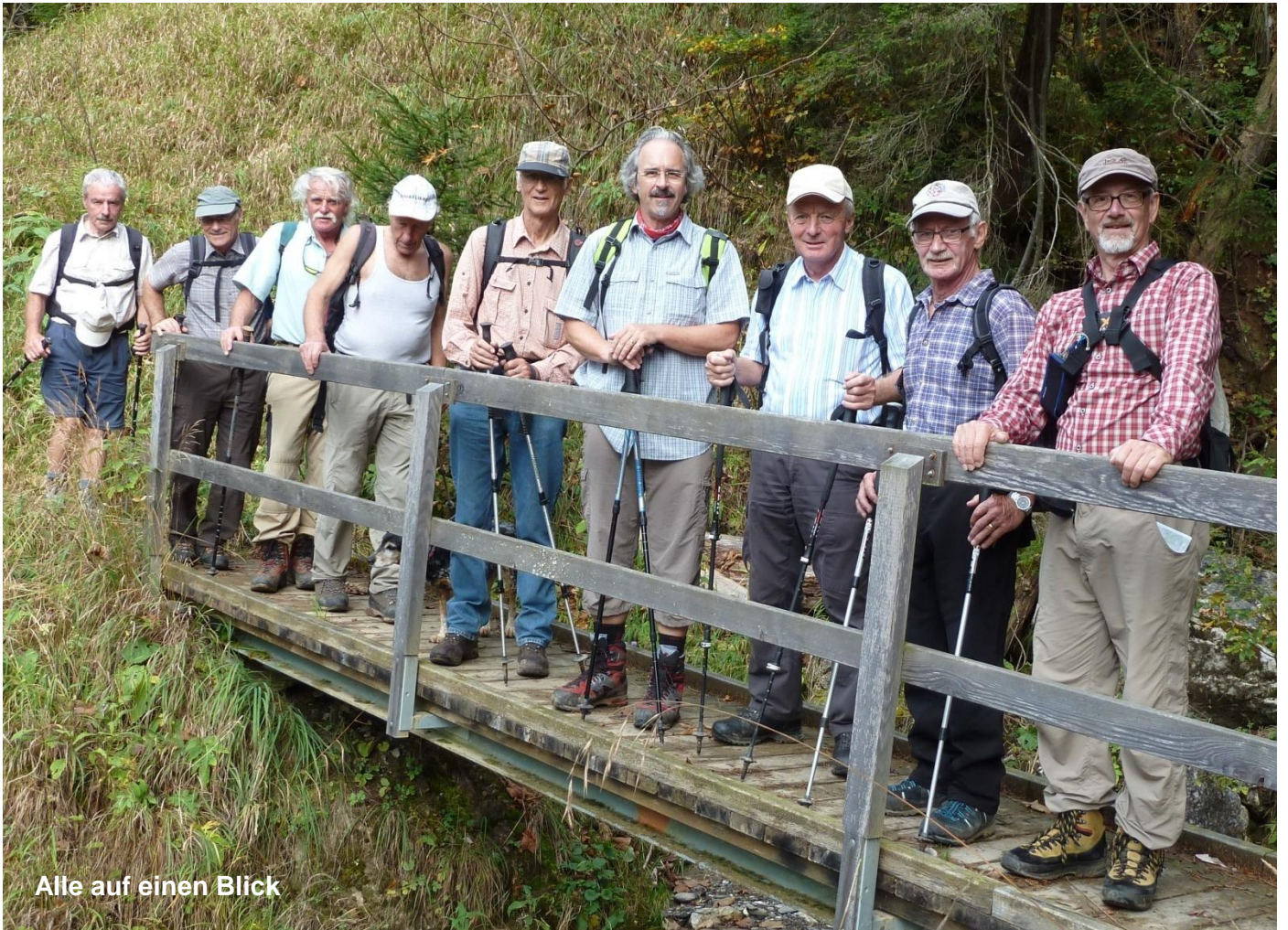
Alle auf einen Blick