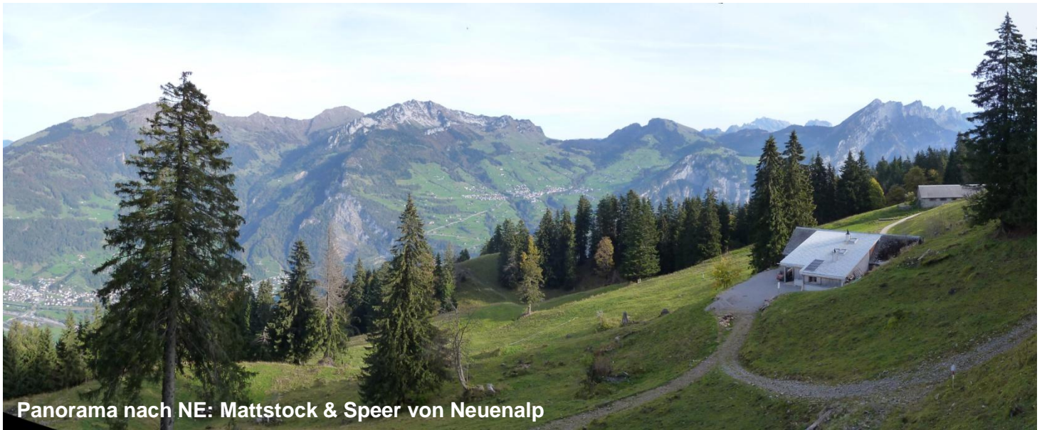
Panorama nach NE: Mattstock & Speer von Neuenalp