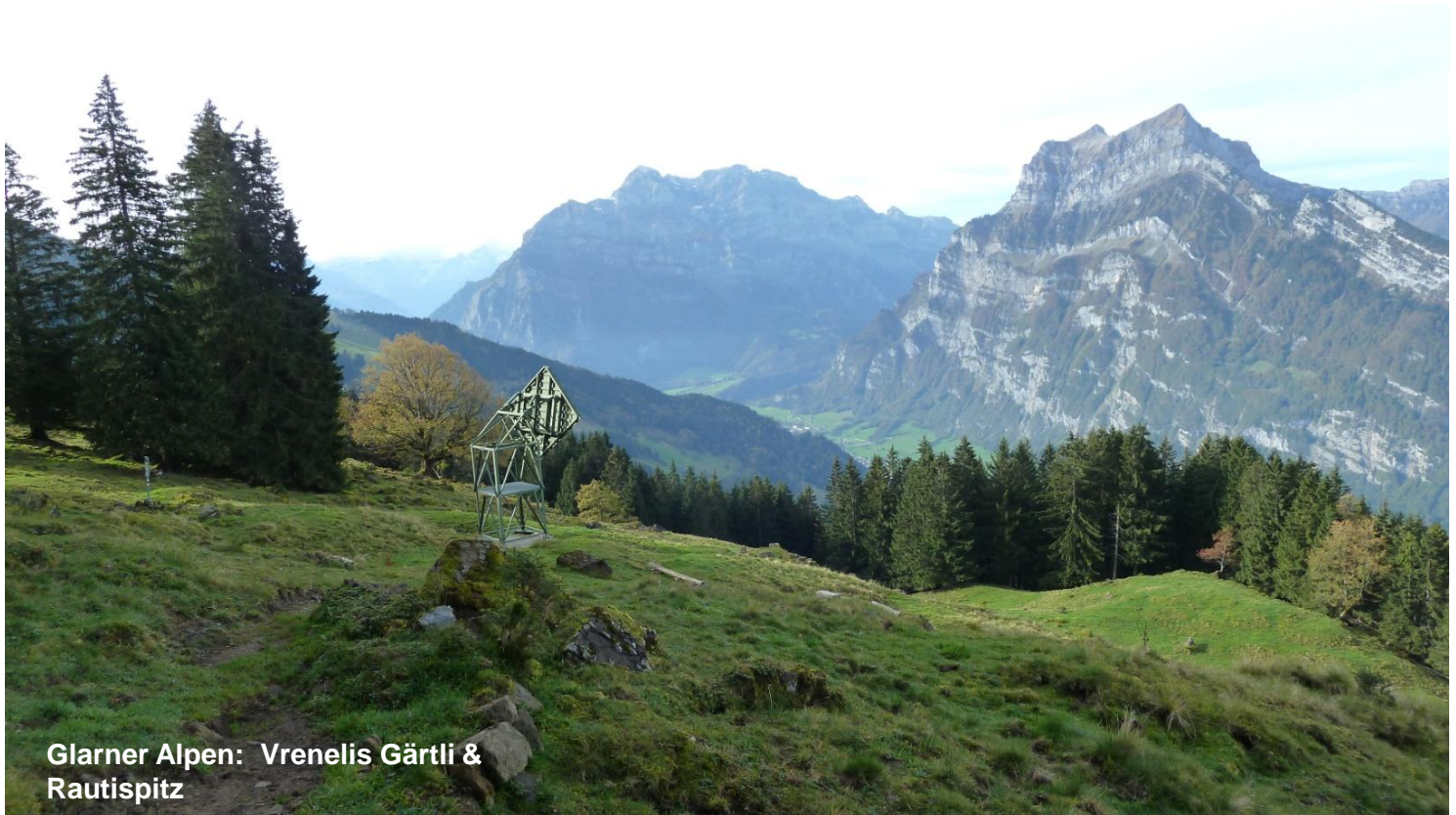
Glarner Alpen: Vrenelis Gärtli & Rautispitz