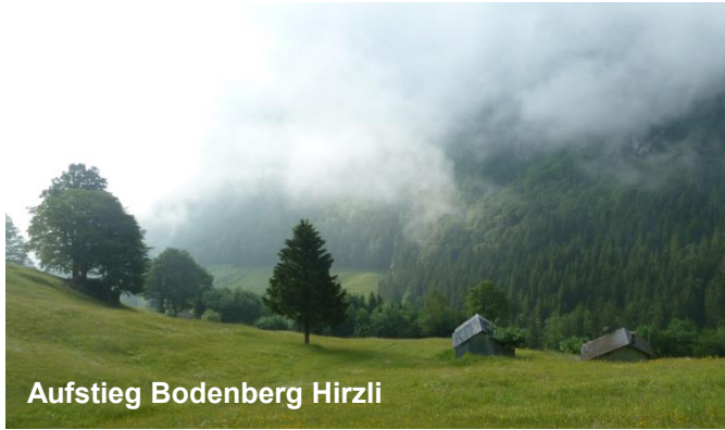
Aufstieg Bodenberg Hirzli