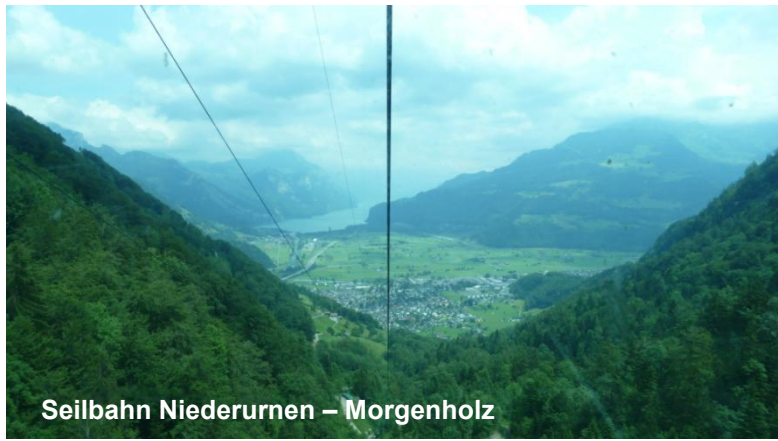
Seilbahn Niederurnen – Morgenholz