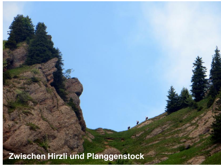
Zwischen Hirzli und Planggenstock