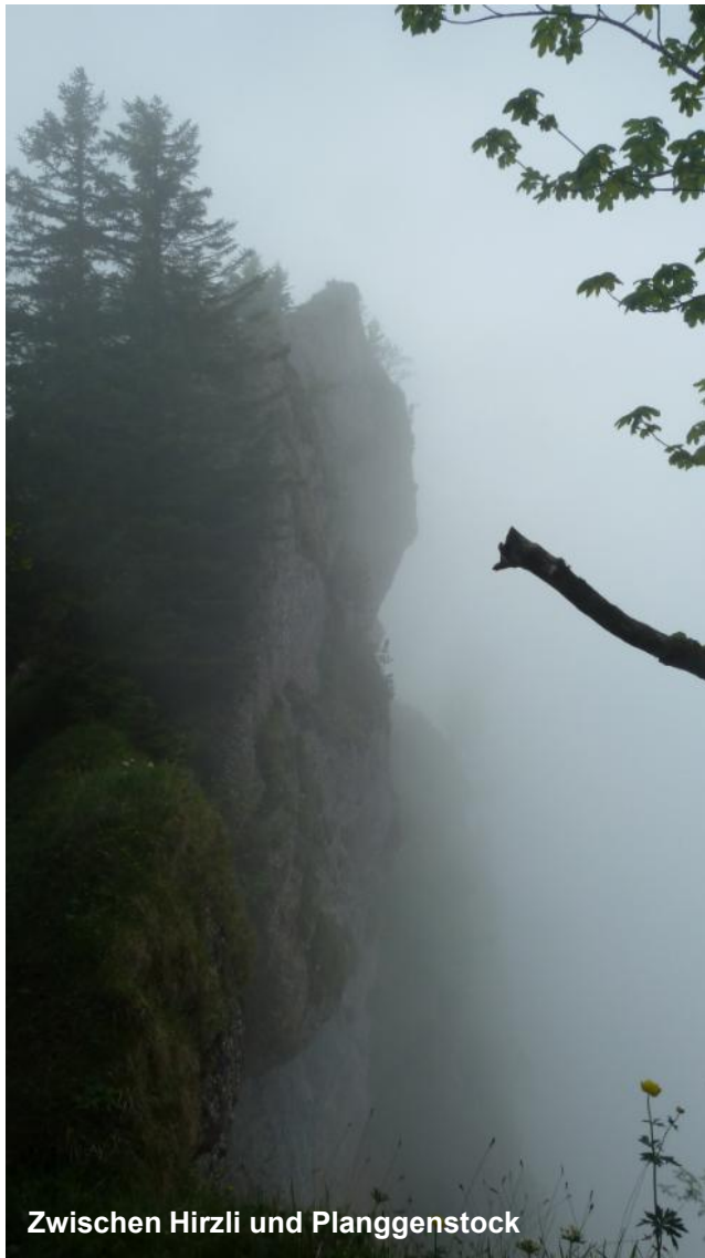
Zwischen Hirzli und Planggenstock