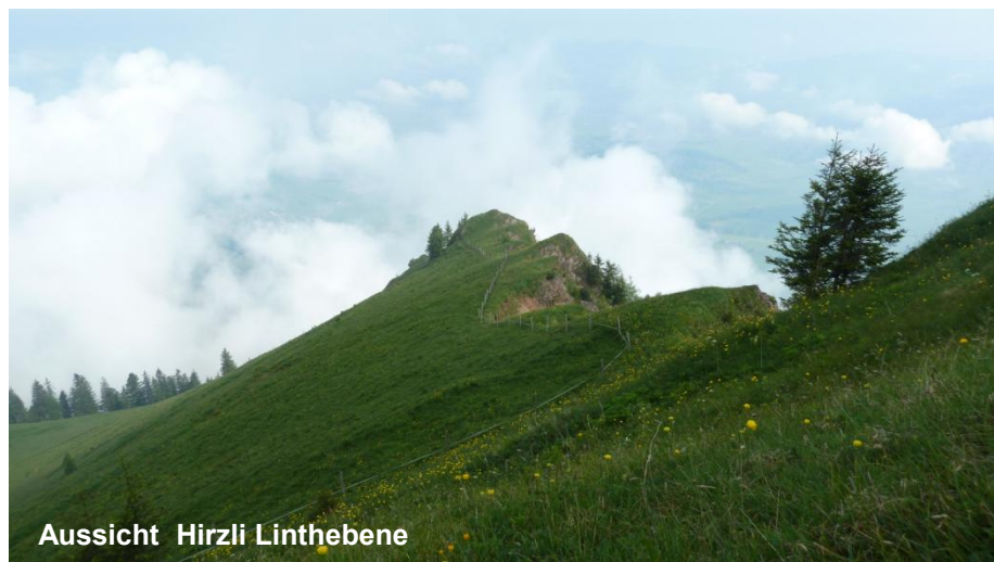
Aussicht Hirzli Linthebene