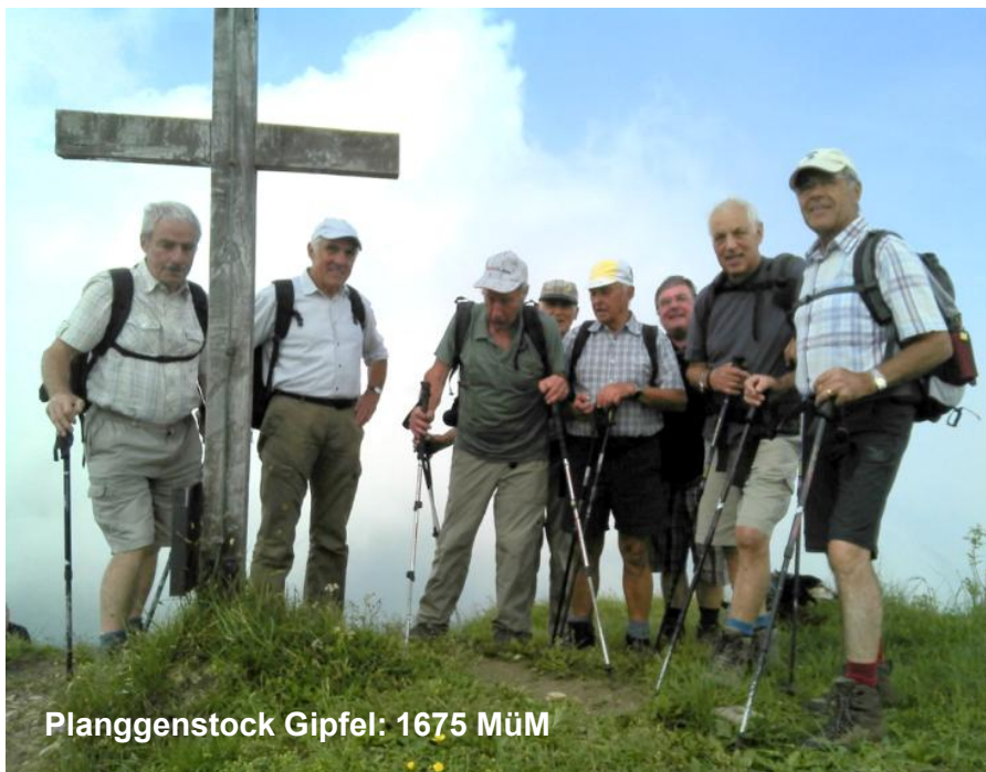
Planggenstock Gipfel: 1675 MüM