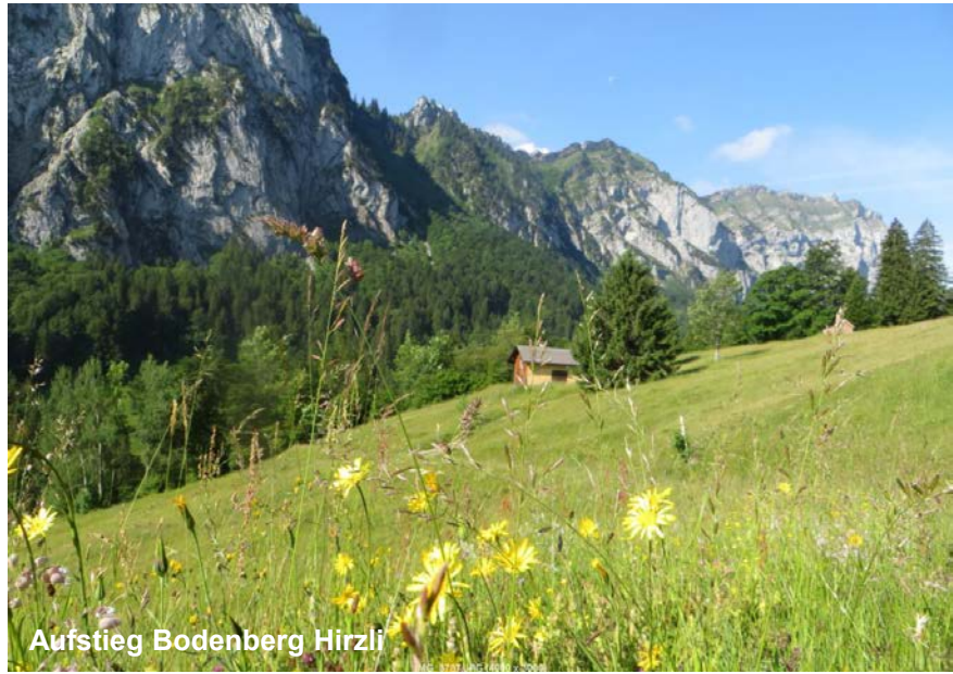
Aufstieg Bodenberg Hirzli