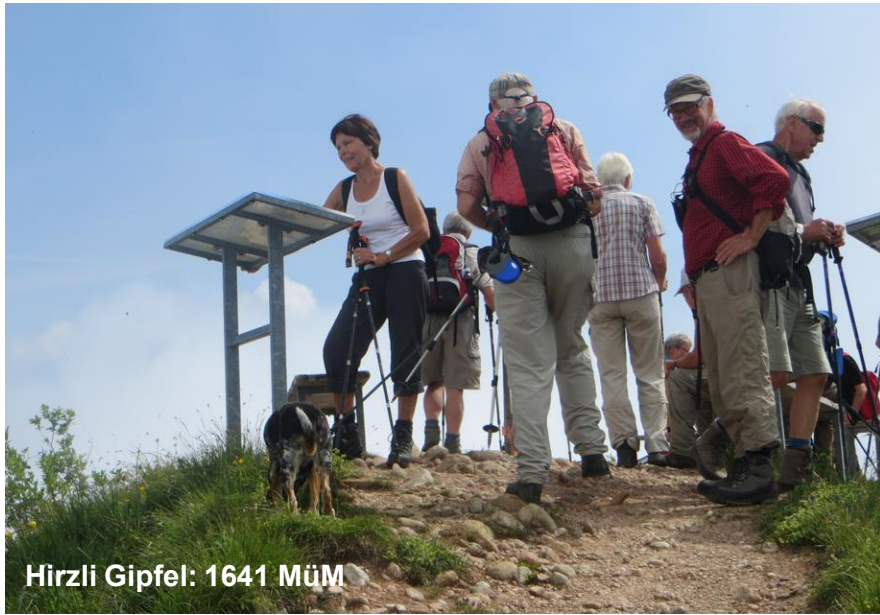
Hirzli Gipfel: 1641 MüM