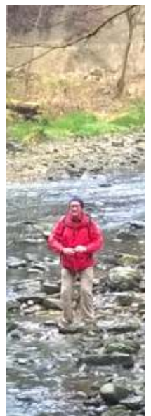
und in deren Bachbett ...