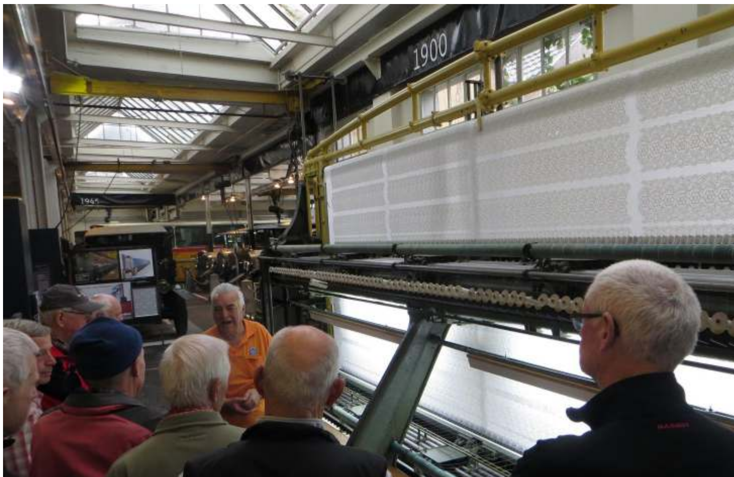
Die Stickmaschinen sind noch in Betrieb