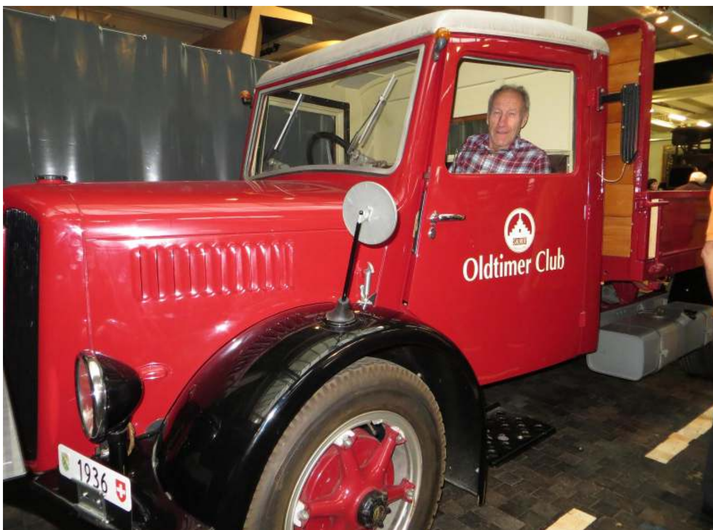
Zwei Jahrgänger vereint . . .