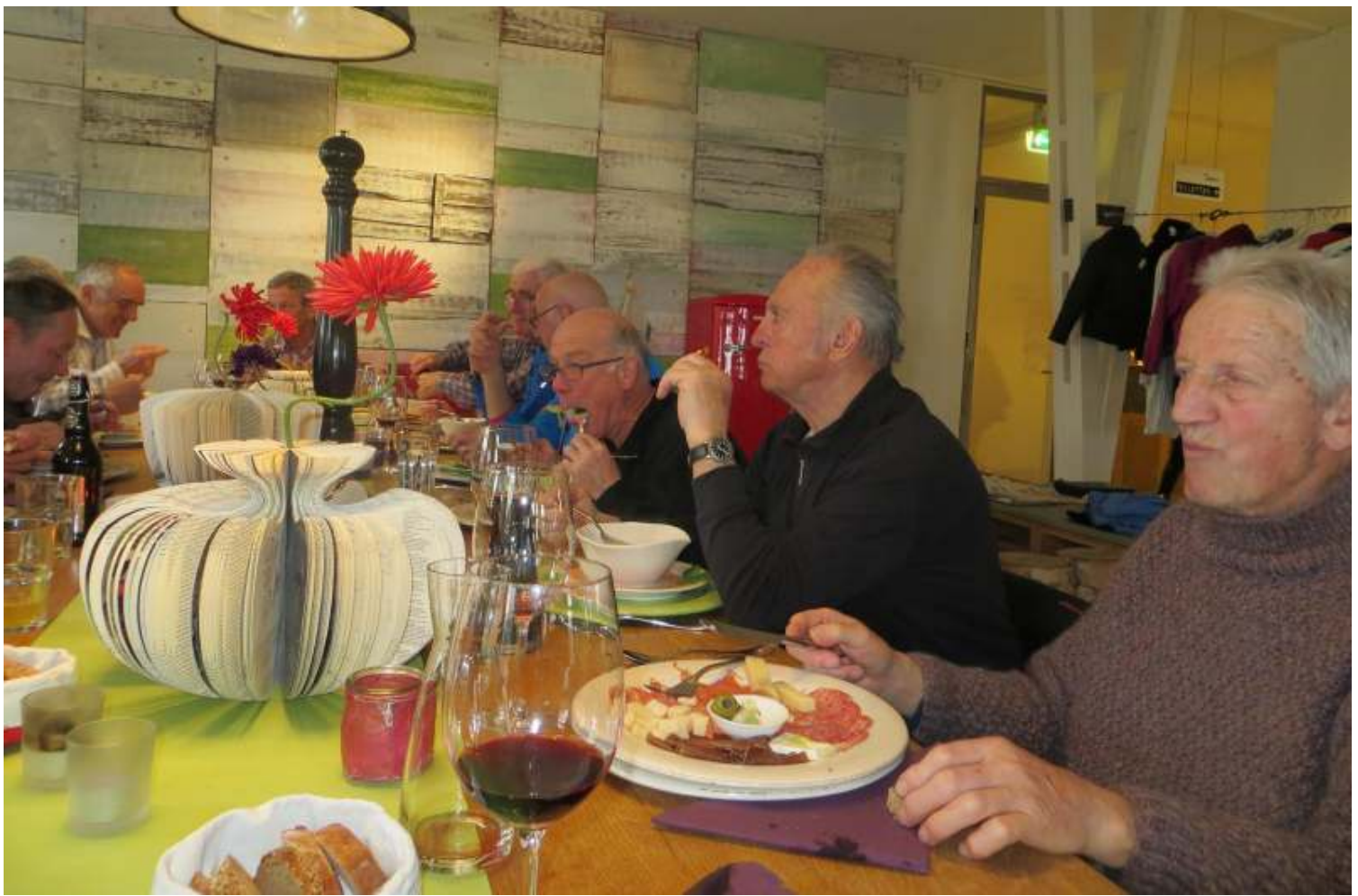
Mittagessen in der alten Fabrik-Kantine der Firma SAURER