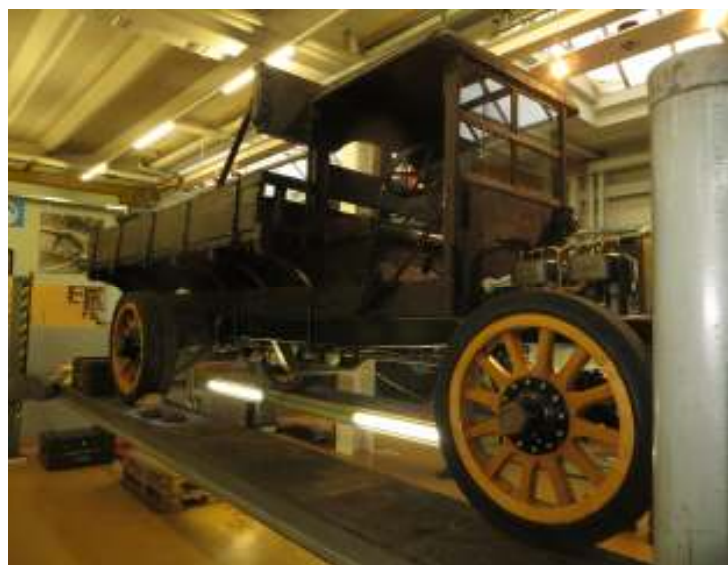
Ein ganz spezielles Fahrzeug, der Caminhao : Jahrgang 1911