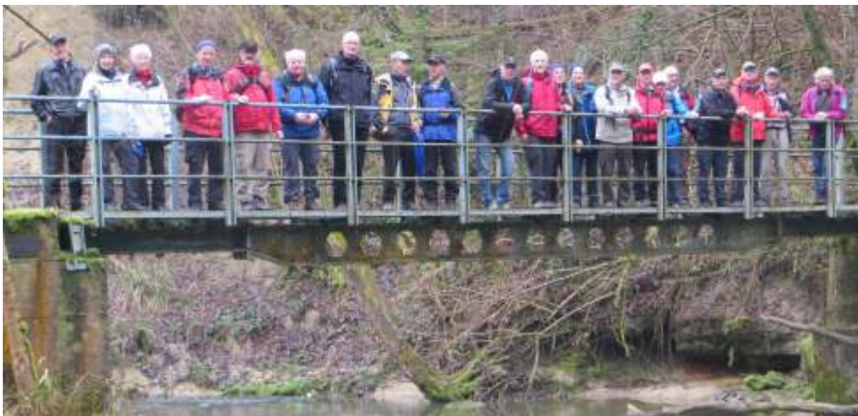
Auf dem Gallussteg – über der Steinach