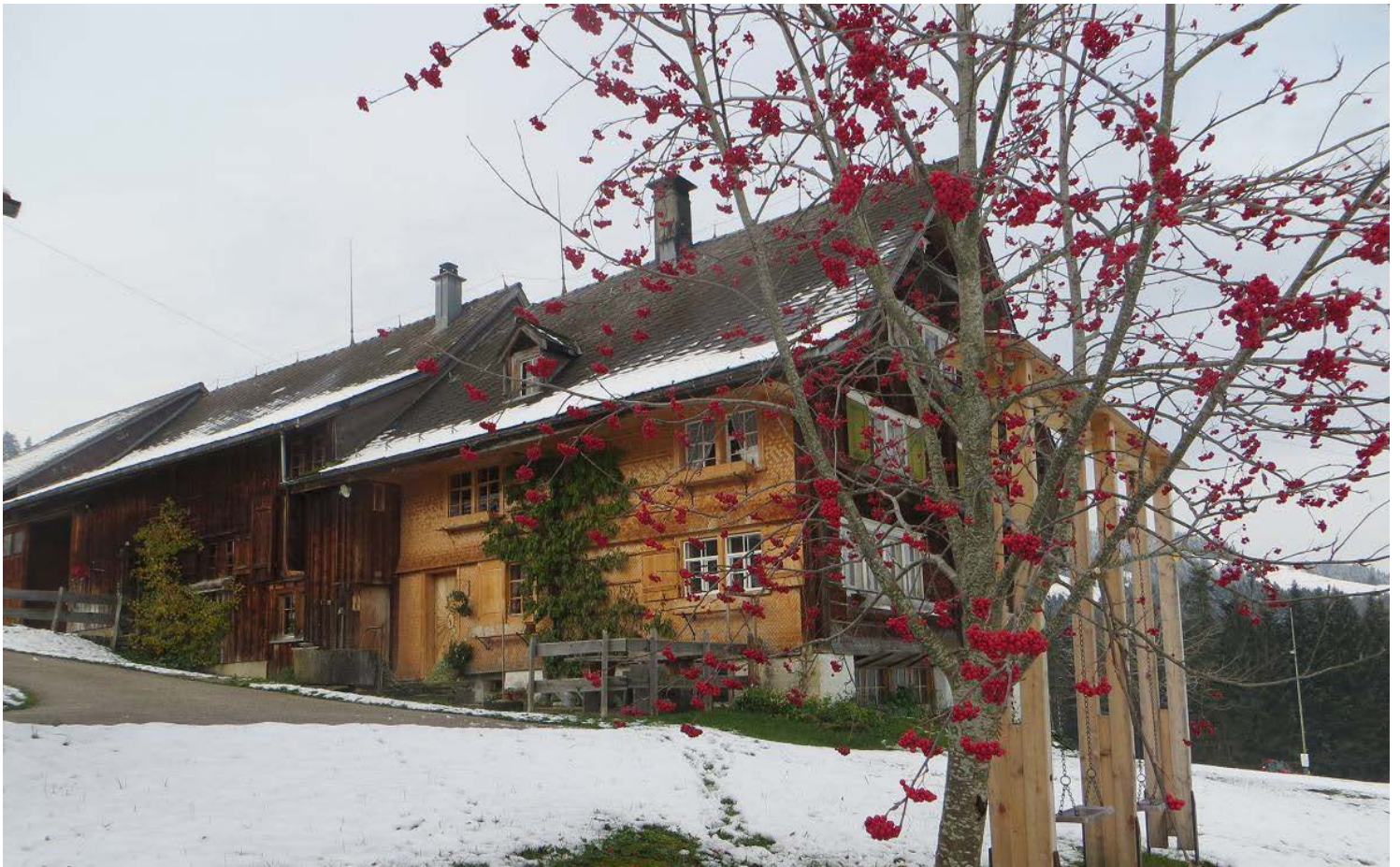
... und bald waren die Wiesen schneebedeckt