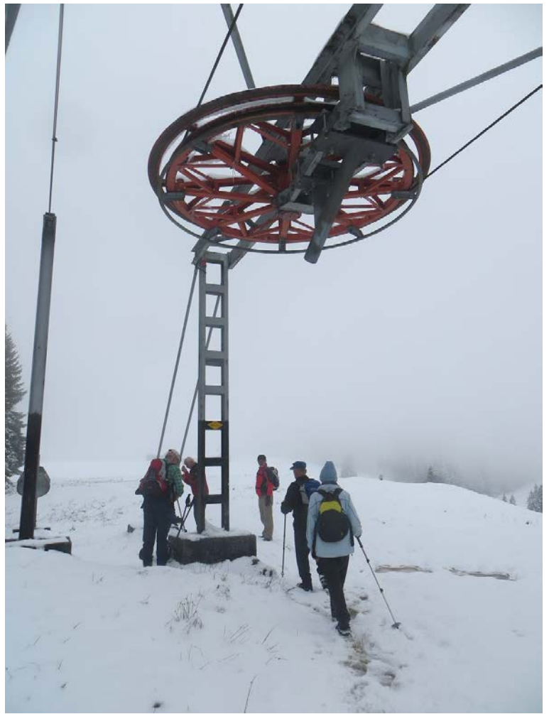
Bei einer kurzen Teepause kommen Erinnerungen an die damaligen FIS-Skirennen mit dem GIRLEN-RIESENSLALOM auf ...