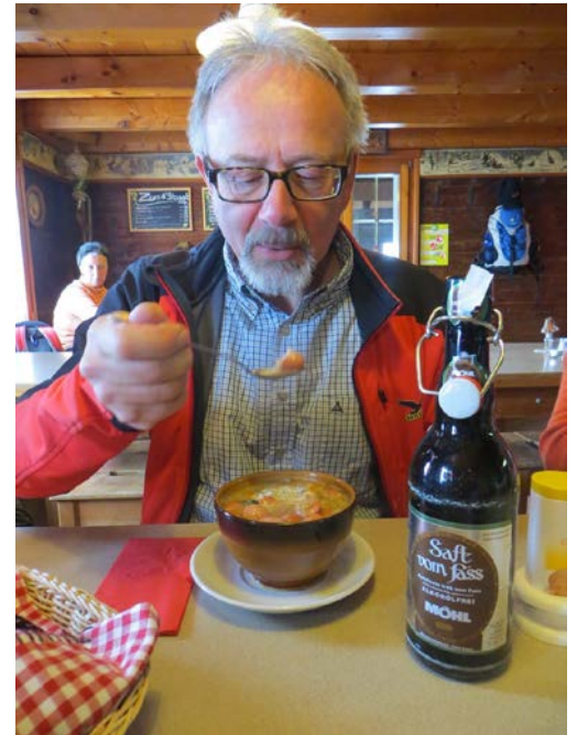
Bei einer bissigen Bise schätzt man die Ankunft im warmen Bergrestaurant – dazu eine feine Suppe – sehr wohl !