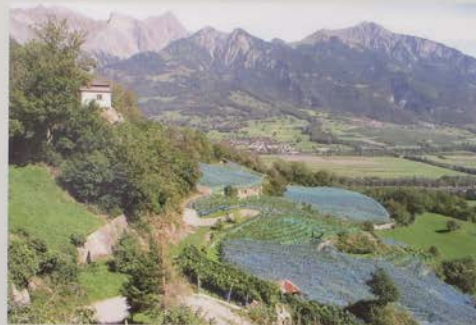
Porta Romana mit Blick auf die Bündner Herrschaft