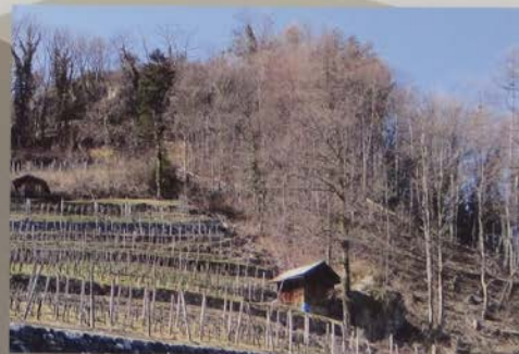
Rebberge im Winterhalbjahr