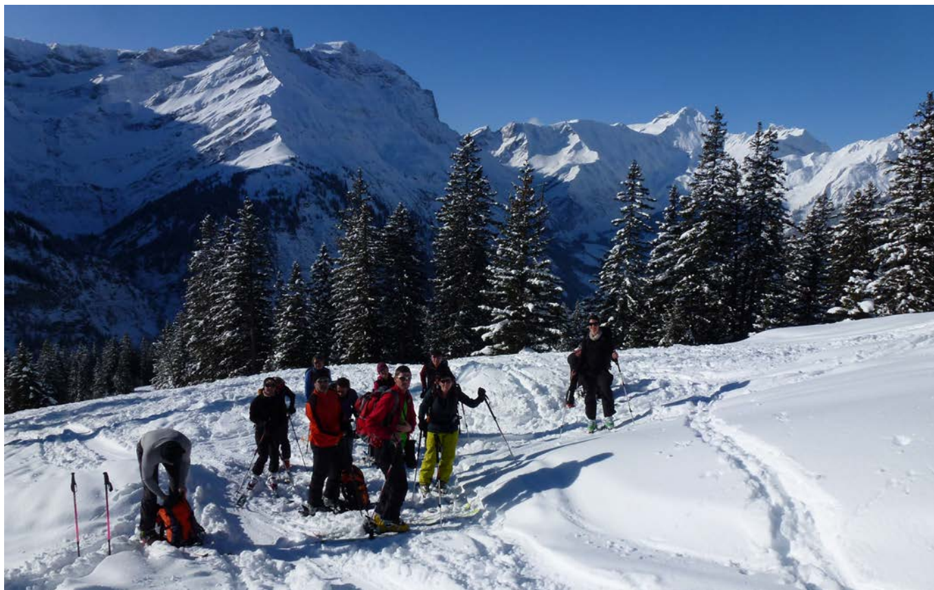
Zwischenhalt. Im Hintergrund rechts der Hausstock.