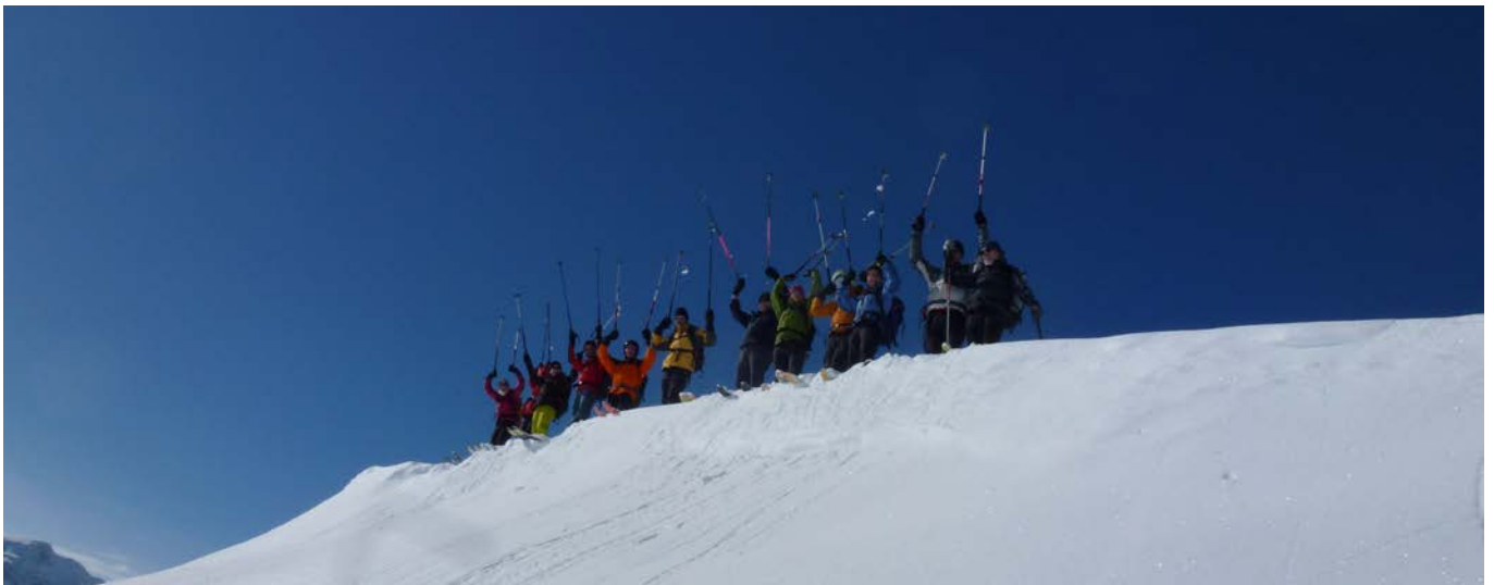
Auf Los geht's Los !