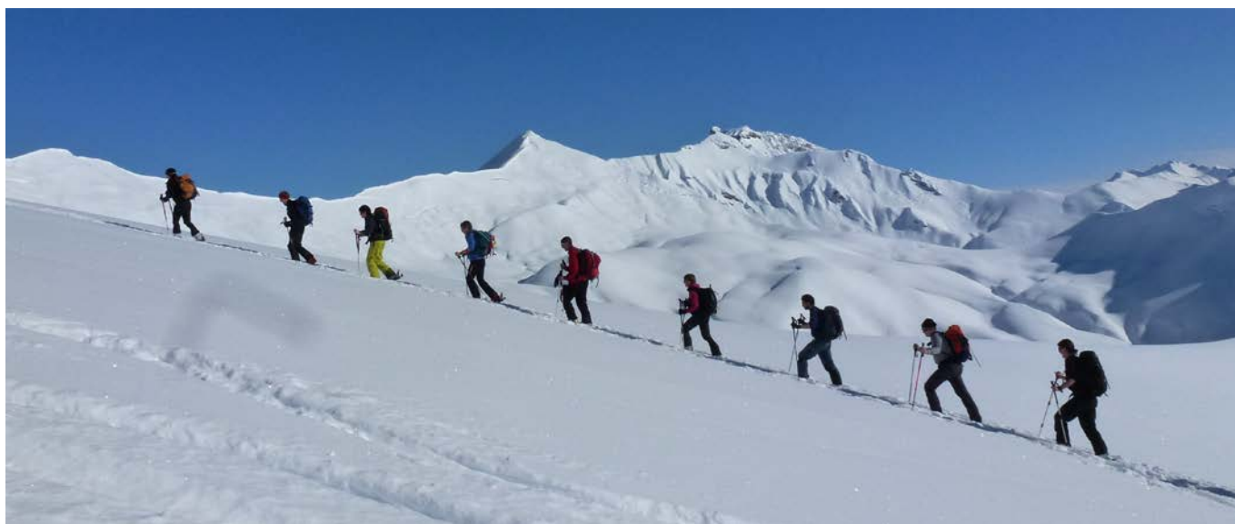
Im Aufstieg kurz vor dem Gipfel. Im Hintergrund Grünenspitz und Foopass.

Tourenleiter: Marion Spirig Anzahl Teilnehmer: 13 Datum, Ziel: Sonntag, 17. Februar 2013 Talort: Elm - Wiesli, 1040 m.ü.M. Abmarsch .. Rückkehr: 08:15 Uhr .. 13:30 Uhr (Aufstieg 3h) Pausen: 1x 15 min. / 1x 30min Anreise mit: 3 Autos Abfahrt in Altstätten: 06:30 Uhr