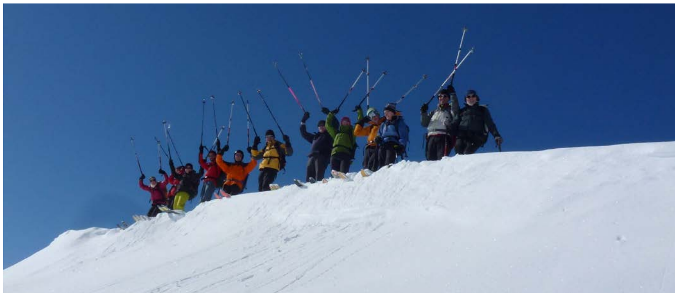
Start der wilden Horde unter dem Gipfel.