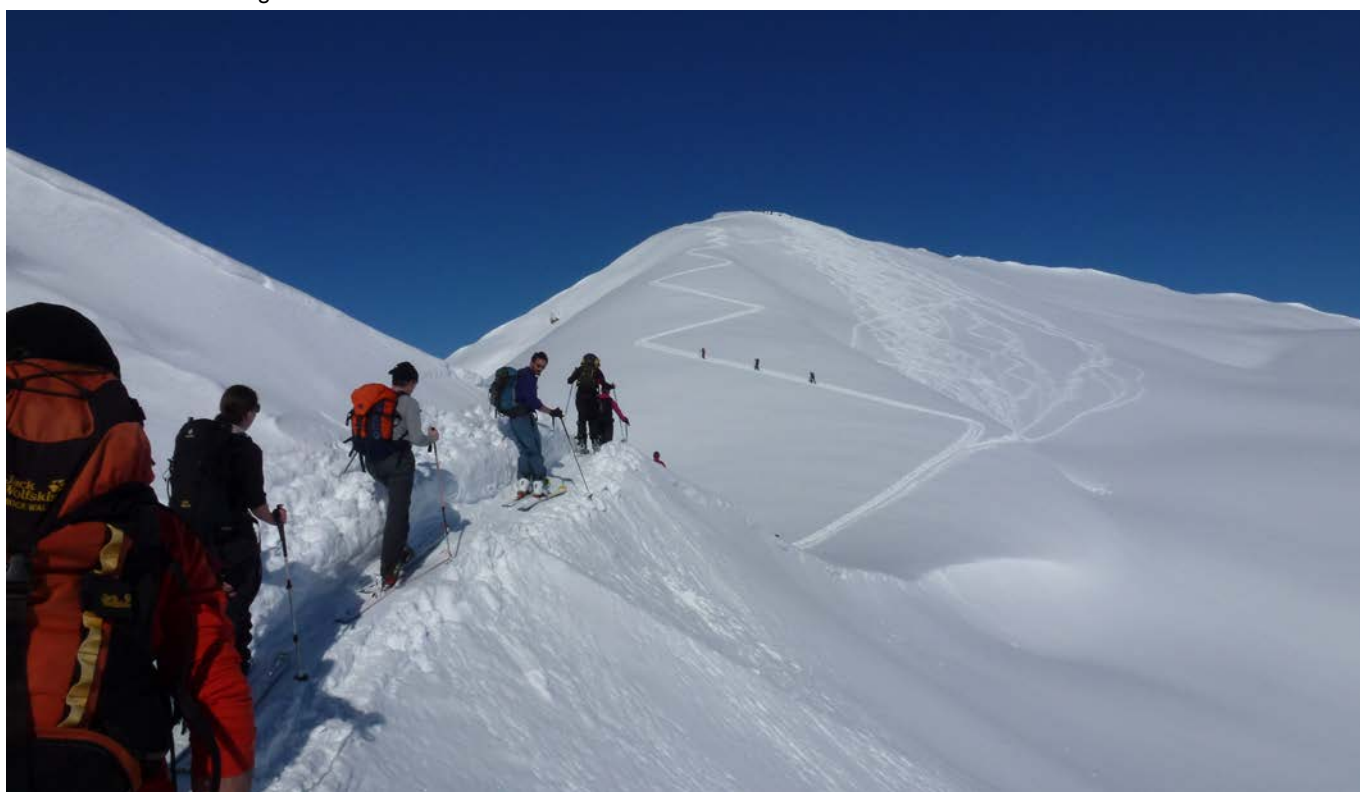
Aufstieg, kurz vor dem Gipfel.