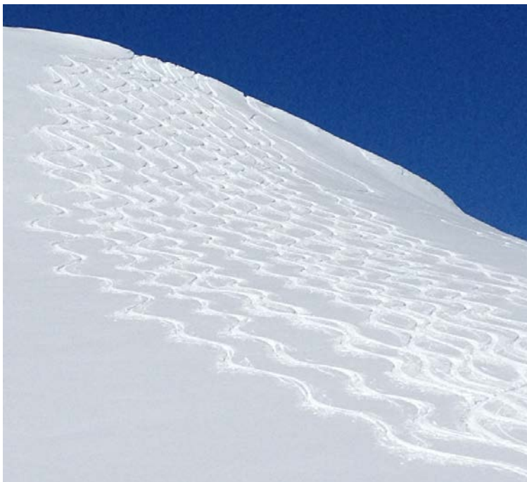
vollbrachtes Werk !