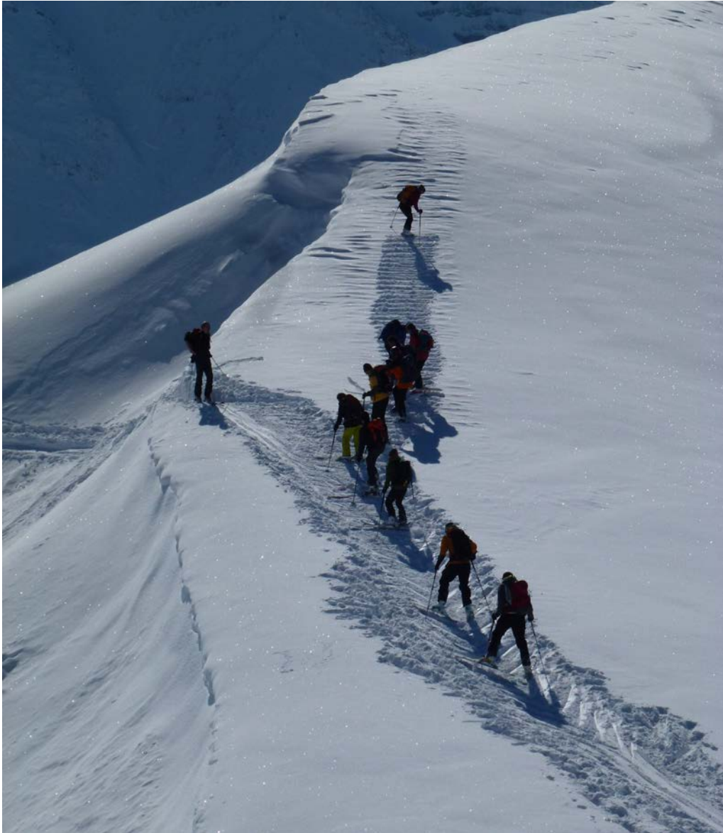
auf dem Weg zum jungfräulichen Hang ...