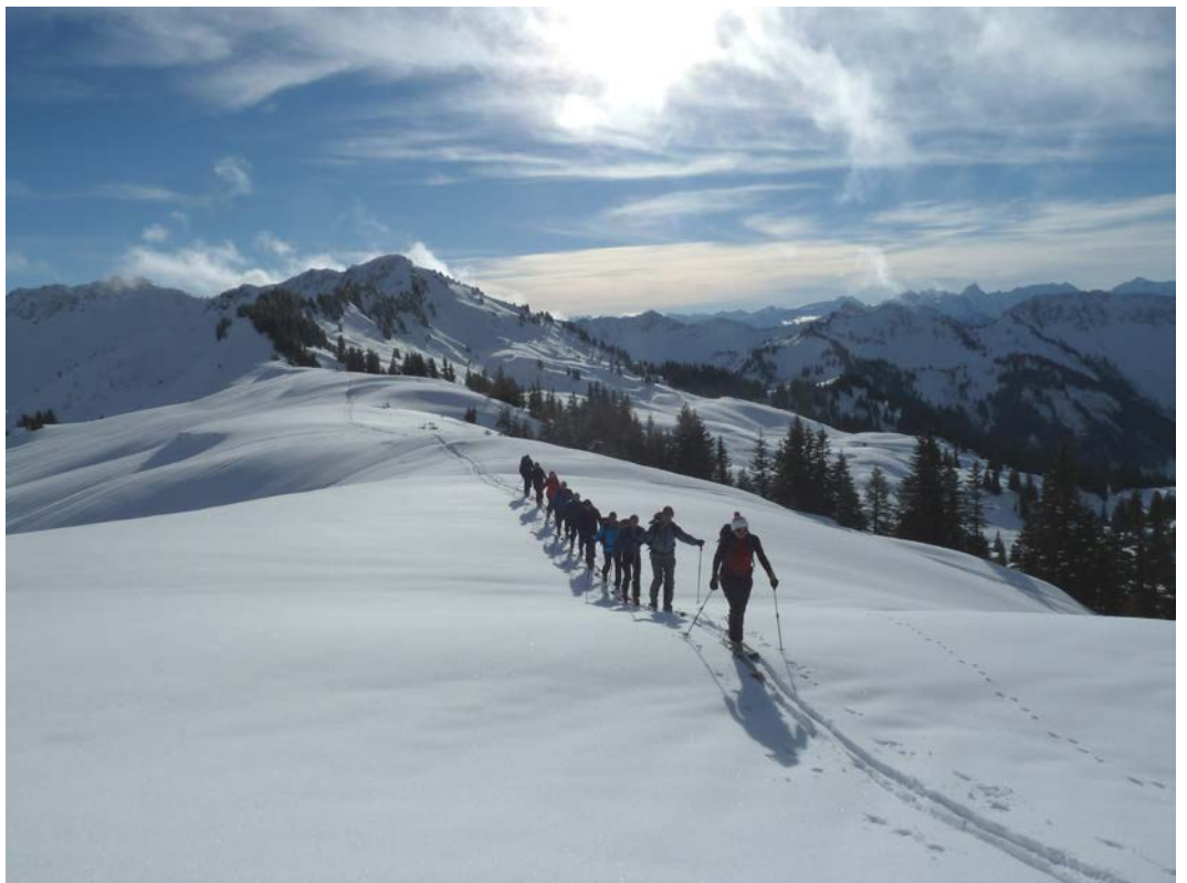
Gäviser Höhe, 1788m