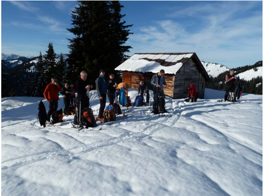
Tee- Pause unter der Gävisalpe, ca. 1650m