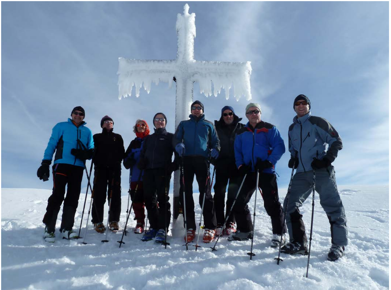
Eisverziertes Gipfelkreuz, Matona 1147m