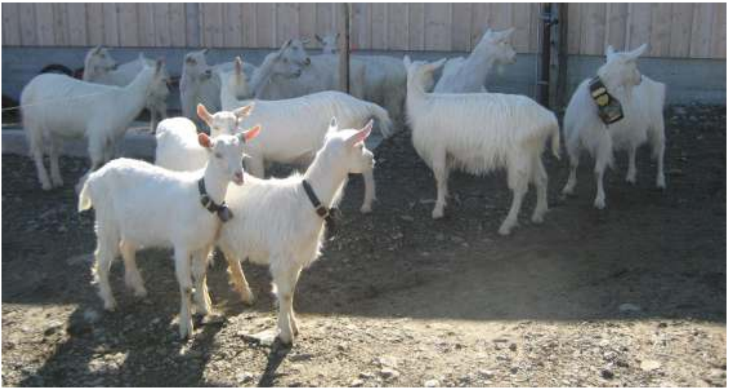
Begegnungen mit verschiedenen "Bewohnerinnen und Bewohnern" rund um und auf Alp Fülder . . .