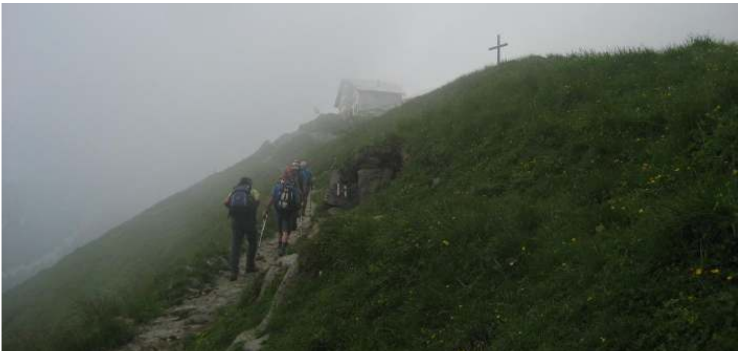
kurz vor dem Schäfler