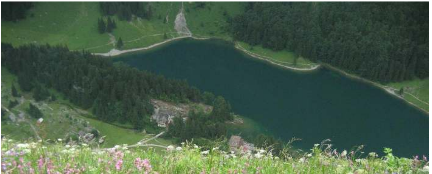
Blick hinunter zum Seealpsee . . .