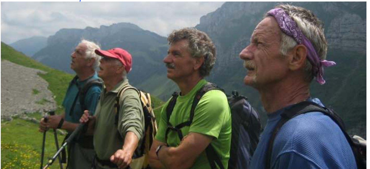
. . . und hinauf zu leuchtenden Feuerlilien !