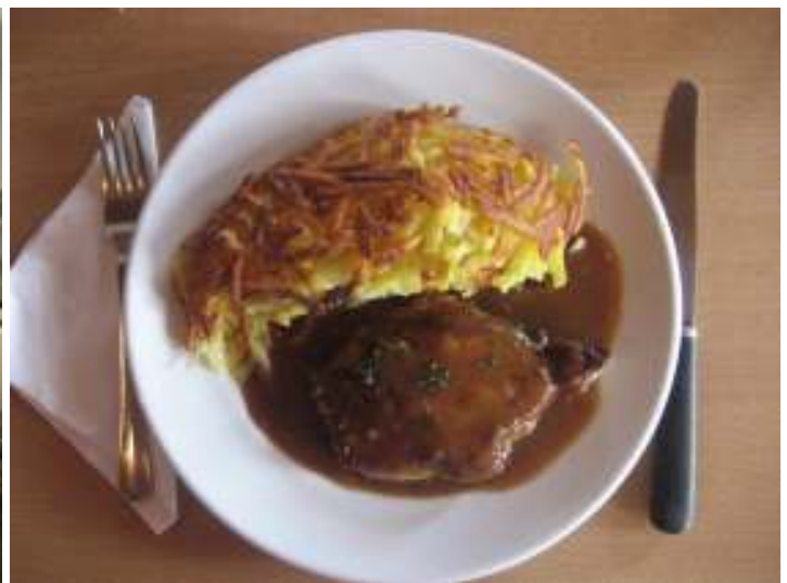
MMhhh ... war dieser Rösti - Zmittag fein ! Dabei durften wir dem Koch "über die Schulter" sehen und wertvolle Tipp's für die Zubereitung erfahren - Danke