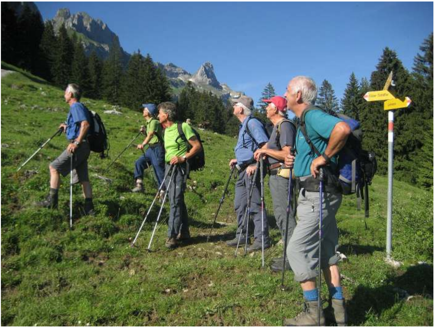
Am Morgen treffen wir herrliche, klare Sichtverhältnisse an