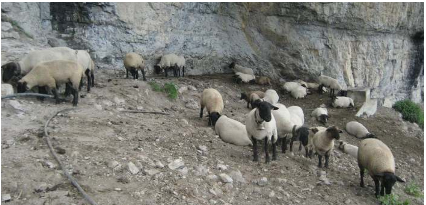
Auch diese Schafherde hat unter dem weit auskragenden Felsendach (!) ihren trockenen Unterstand . . . kurz vor dem Äscher