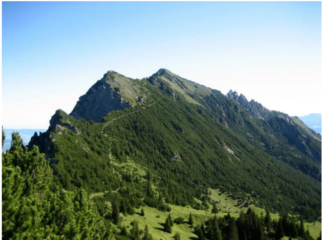
Nachdem wir den Fürstensteig passiert hatten, zeigte sich das nächste Ziel, der Kuegrat auf 2123 m.