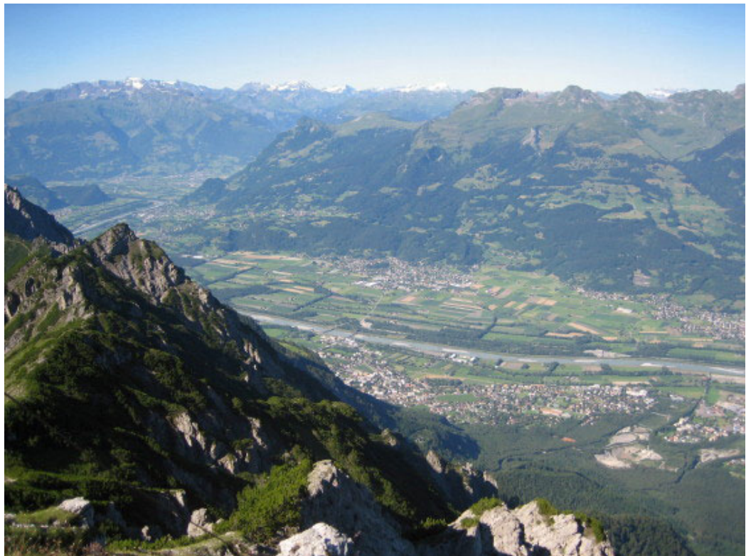
Hier oben genossen wir den Tiefblick auf Liechtenstein und das Rheintal sowie die Fernsicht auf die Berge des Glarner Landes, die an ihren markanten weißen Firnhauben gut zu erkennen waren, sowie auf das Rätikon und die Gipfel in ganz Vorarlberg.