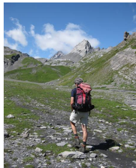
Im Aufstieg zu Col de la Forcla