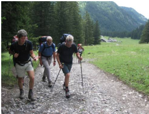
Im Aufstieg von Solalex zum Pas de Cheville