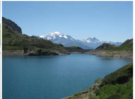
Der Lac de Fully – im Hintergrund der Grand Combin