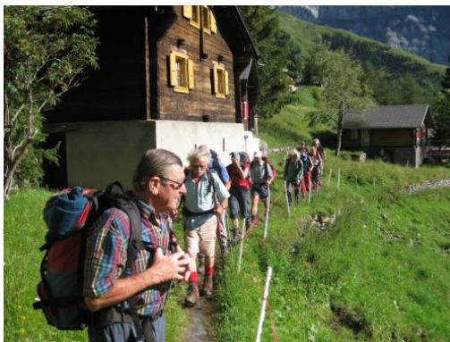
Am Ufer des Lac de Derborance