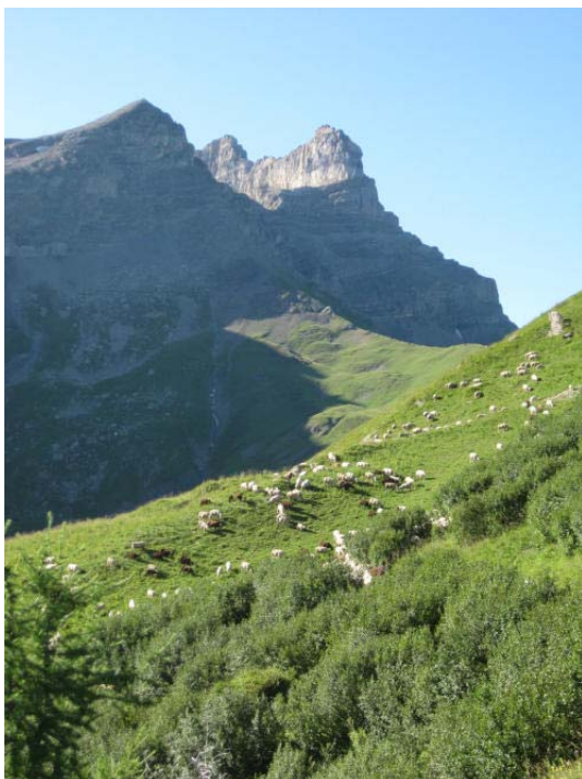
Schafe vor den Dents des Morcles