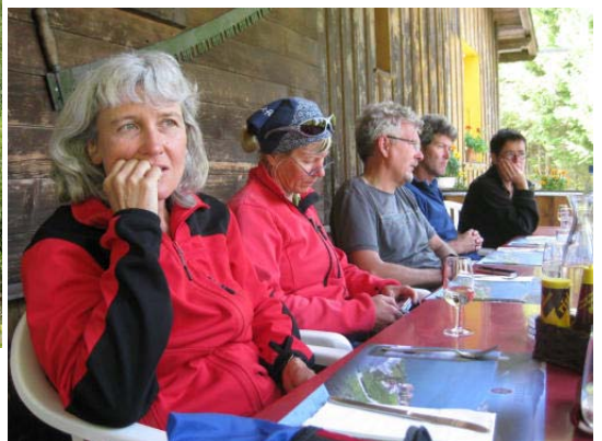
Abschluss im Restaurant in Les Plans-sur-Bex