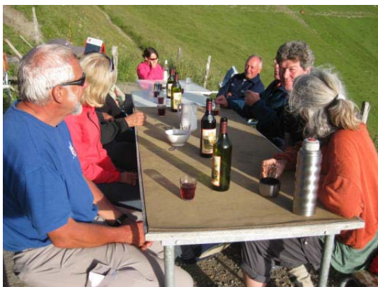
Abendessen vor der Cabane de la Tourche.