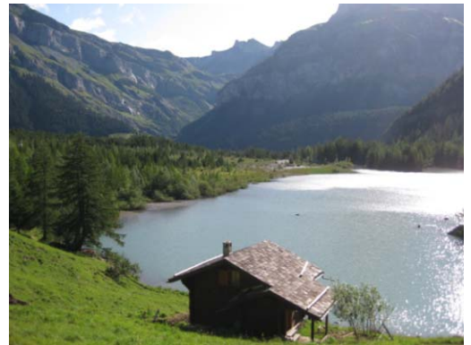
Der Lac de Derborance im Morgenlicht