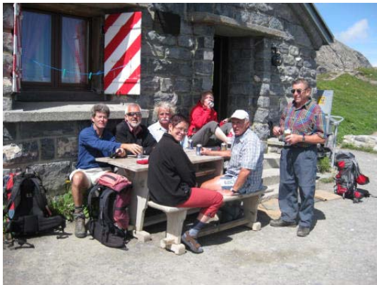
Vor der Cabane Rambert