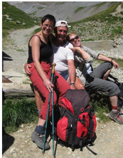
Alle hatten ihren Spass...