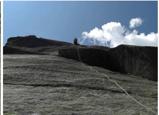
(Plaisir pur am Grimsel)